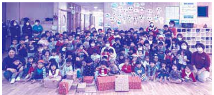
認定こども園みらい