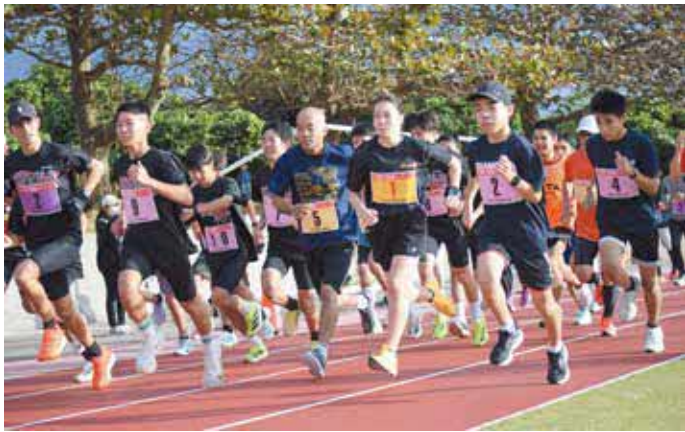
新春ロードレース大会の様子