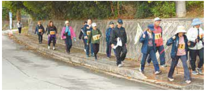
新春歩け歩け大会の様子

村では、毎月第1日曜日に健康ウォーキングを開催しています。健康づくりのキッカケとしてお気軽にご参加ください。