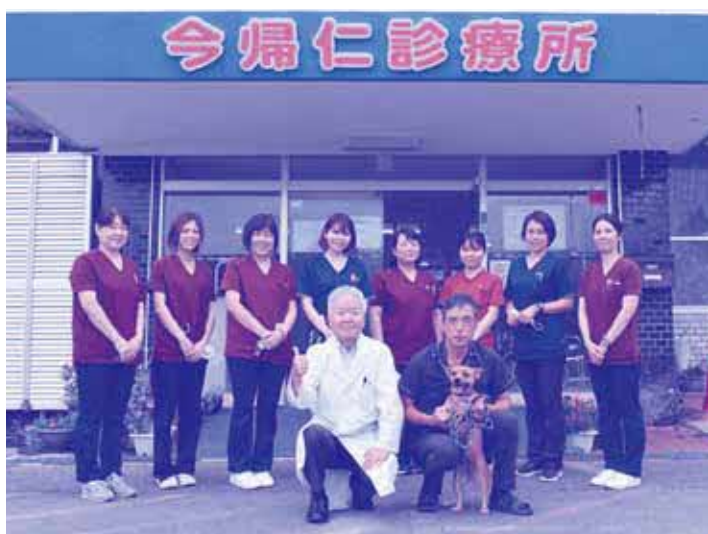
▲今帰仁診療所のみなさん

社会福祉法人五和会 医療型障害児入所施設名護療育医療センター 名誉院長 今帰仁村特別支援保育運営委員、今帰仁村要保護児童対策地域協議会委員 ほか