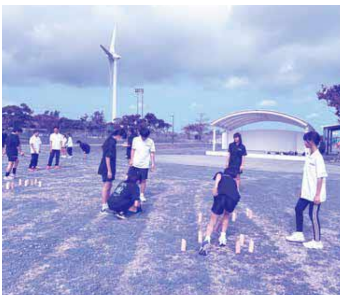
▲「モルック」を行うジュニアリーダーのみなさん