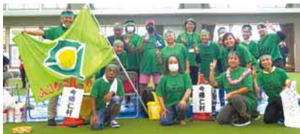
▲3年ぶりの現地開催!楽しい交流会になりました。