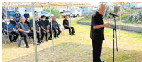
▲幸せと平和を願い手を合わせました

去る戦争により、犠牲となった村出身の戦没者を追悼し、恒久平和を祈念する「平和祈願祭」を10月16日、今帰仁村慰霊塔前で村役場・今帰仁村遺族会共催で執り行いました。参加者全員で黙祷し、戦争の悲惨さと平和の尊さを継承する思いを新たにしました。