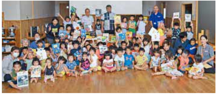
あめそこ保育園の皆さん

絵本をプレゼントされた子どもたちは、たくさんの絵本にキラキラと目を輝かせ、大喜びしていました。