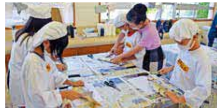
放流体験と魚をさばいている兼次小学校5年のみなさん