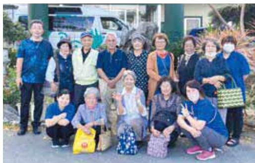
▲シルバー学級の皆さん

今帰仁村教育委員会では毎年、シルバー学級を開催しています。みなさんのご参加、お待ちしております。