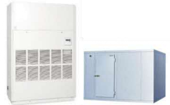
温度管理を要する装置・設備の導入