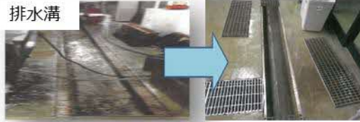
排水溝 施設の衛生管理の強化に向けた排水溝、床、壁等の改修