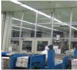
空気を經由した汚染の防止設備 (パーティション) の導入

施設整備と一体 となつてその効果を一層高める ために必要な費用 (コンサル費等)