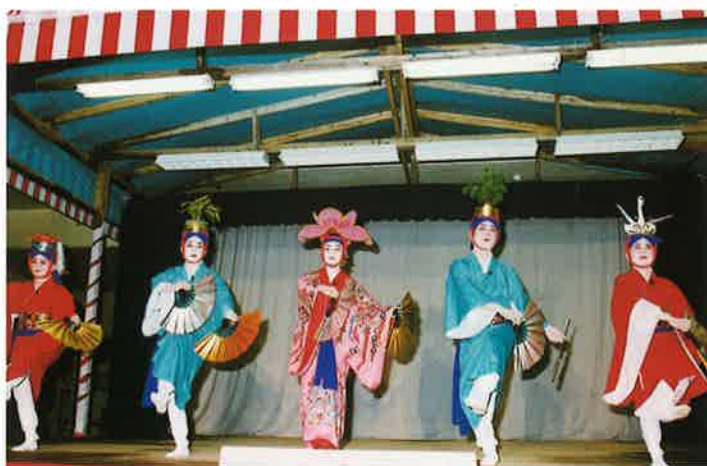
▲今泊区・松竹梅鶴亀

九月十三、十四の両日村内七ヶ字（今泊、仲尾次、崎山、謝名、湧川、勢理峯、上運天）で五穀豊穰を願う豊年祭が盛大に行われた。 当日は台風の影響もあり、雨の降る悪天候の中行われた。昼間の道ジユネーから始まり、夜の舞台では、長者の大王や獅子舞、棒術、高平万才など古くから地域に伝わる伝統芸能が次々と披露された。 またその日は、故郷のまつりを楽しもうと県内外から多数の人々が訪ね、会場は夜遅くまでにぎわった。