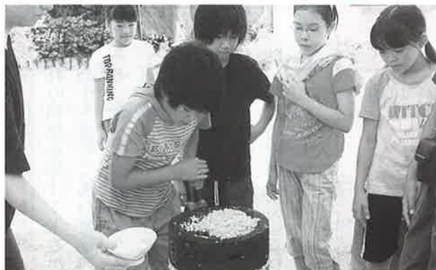
▲興味深く石うすを回す子どもたち

野球を通して親子のきずなを深めようと、村子ども会主催の親子野球大会が八月三十・三十一の両日、村営グラウンドを主会場に開催された。 村子ども会の設立二十年の節目となった今年の大会は、十月下旬に開かれる県大会の村代表を決めるAクラスと、村大会のみのBクラスに分かれて行われた。 A、Bクラス共に今帰仁ジュニアと北山キングが決勝で激突。北山キングが四対〇でBクラスを制し、Aクラスは今帰仁ジュニアが一对〇の僅差で優勝をかざり、県大会への出場を決めた。