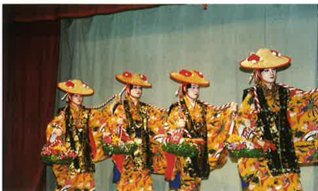
▲謝名区・若衆揚口説