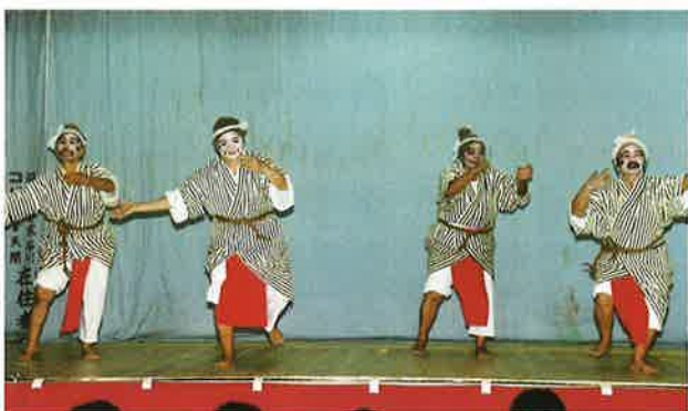
▲崎山区・ダイサナジャー

九月十三、十四の両日村内七ヶ字（今泊、仲尾次、崎山、謝名、湧川、勢理峯、上運天）で五穀豊穰を願う豊年祭が盛大に行われた。 当日は台風の影響もあり、雨の降る悪天候の中行われた。昼間の道ジユネーから始まり、夜の舞台では、長者の大王や獅子舞、棒術、高平万才など古くから地域に伝わる伝統芸能が次々と披露された。 またその日は、故郷のまつりを楽しもうと県内外から多数の人々が訪ね、会場は夜遅くまでにぎわった。