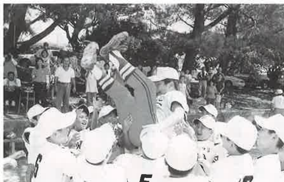
▶Aクラスを制した今帰仁ジュニアの胸上げ