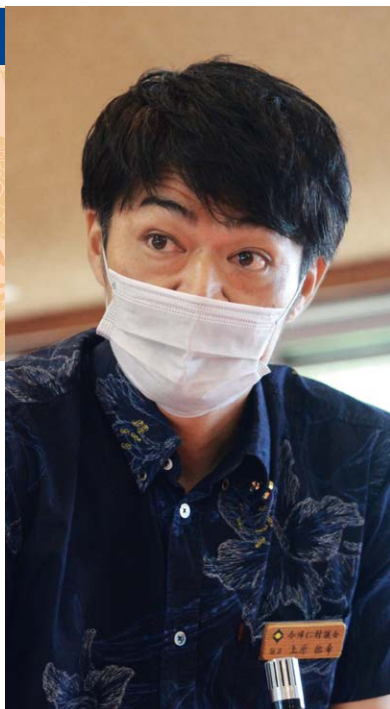
上原 祐希 議員