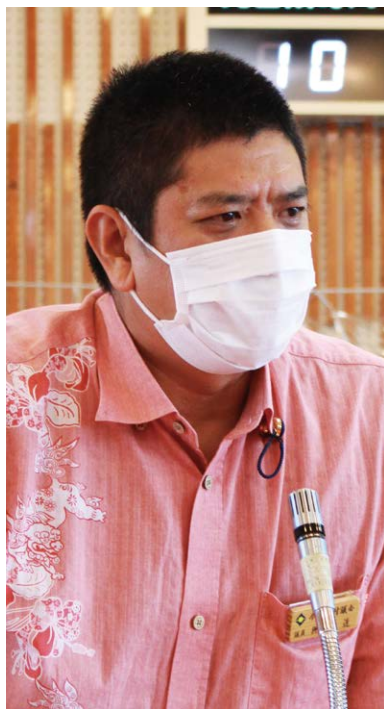
與那嶺 透 議員