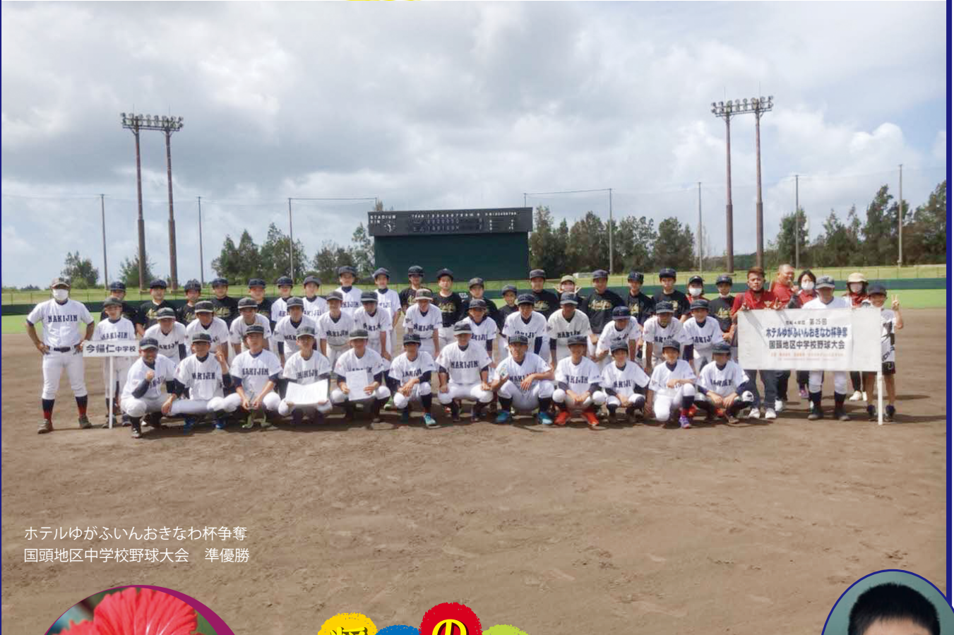
ホテルゆがふいんおきなわ杯争奪 国頭地区中学校野球大会 準優勝