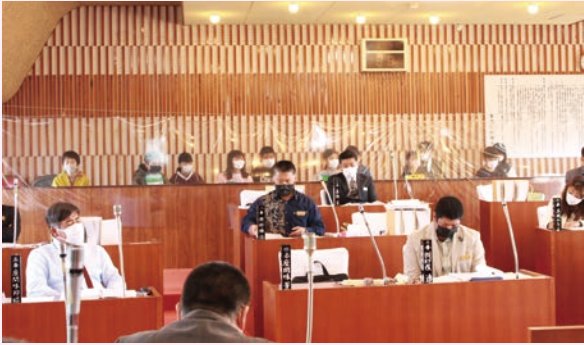
今帰仁小学校 6年1組(9日)