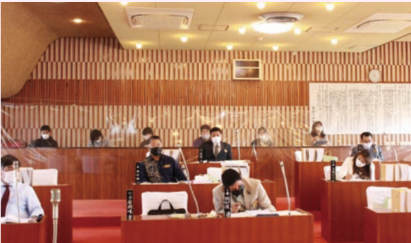
今帰仁小学校 6年1組(9日)