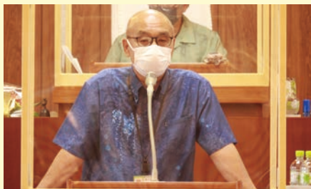
議場で退職の挨拶をする我那覇事務局長