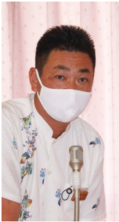
島袋 誠 議員

村道中央線沿線の安全確保については、令和4年2月15日付で仲尾次区長より要請書が出ており、現場も確認している。今後は交通安全対策事業で実施の検討を行っていきたくと考えている。