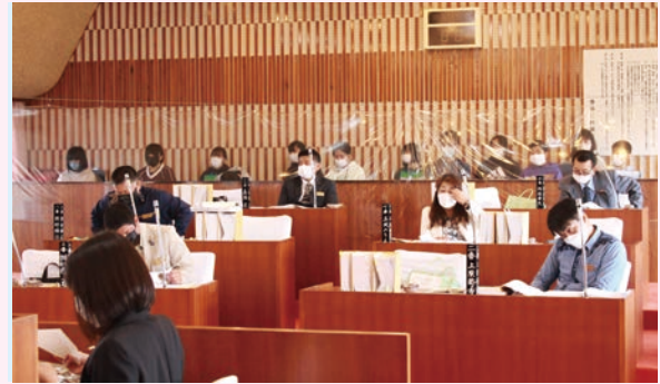
今帰仁小学校 6年1組(9日)