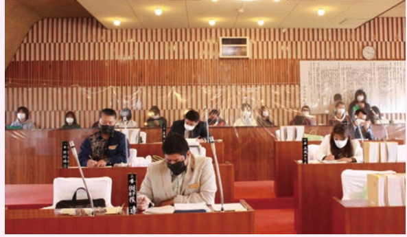
今帰仁小学校 6年2組(9日)