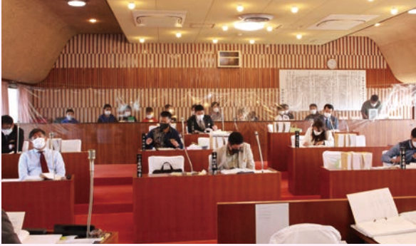
今帰仁小学校 6年2組(9日)

3月9日に今帰仁小学校6年生50人、10日、兼次小学校6年生24人が、社会科授業の『暮らしの中の政治』の一環として、教室の中だけではなく、今帰仁村のために働く人たちがどの