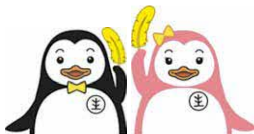
更生ペンギンの ホゴちゃんとサラちゃん

問い合わせ先：北部保護区保護司会 ☎0980-54-5050 ／総務課行政係 ☎0980-56-2101