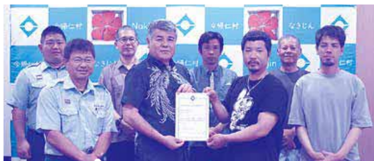
令和7年4月3日認定 仲尾次地区自主防災会

自主防災組織とは、地域の住民が主体となって結成・運営する、防災のための組織です。災害が起こったときに「自分達の地域は、自分達で守る」ことを目的としています。今年度は2つの字を村が認定し、合計4つの自主防災組織が認定されています。