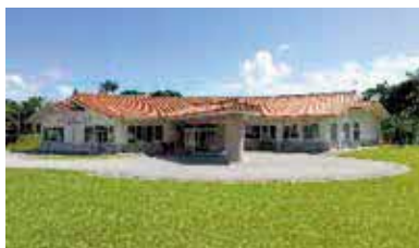
※外観については変わりません。