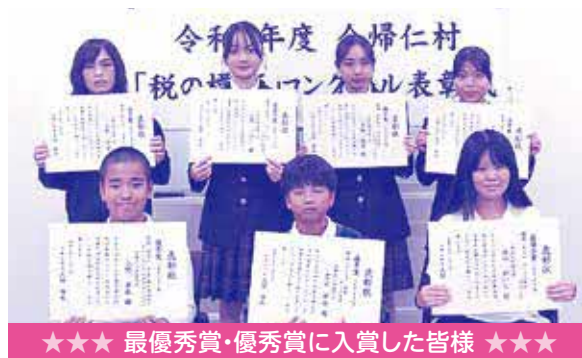
★★★ 最優秀賞・優秀賞に入賞した皆様 ★★★