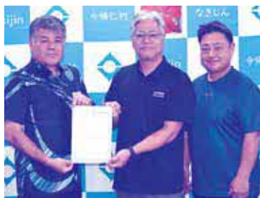
令和7年10月7日認定 玉城地区自主防災会