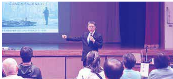
12/6(土) 防災講演会Ⅱ in 今帰仁村

地震や津波は予告なく訪れます。そして、地震・津波などの発災時は、すぐに警察や消防職員が助けに来ることができません。日頃の生活から防災を取り入れ、自分の命と大切な人の命を守るように心がけていきましょう。