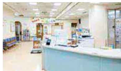
※内部のイメージ写真です。