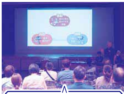
10/2(木) 防災講演会 in 今帰仁村