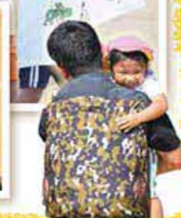
認定こども園 まほろば保育園