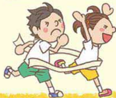
認定こども園みらい