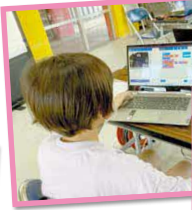
【マイクロビットプログラミング講座】 じゃんけんゲームを作ったり イライラ棒を作るのが楽しかった。