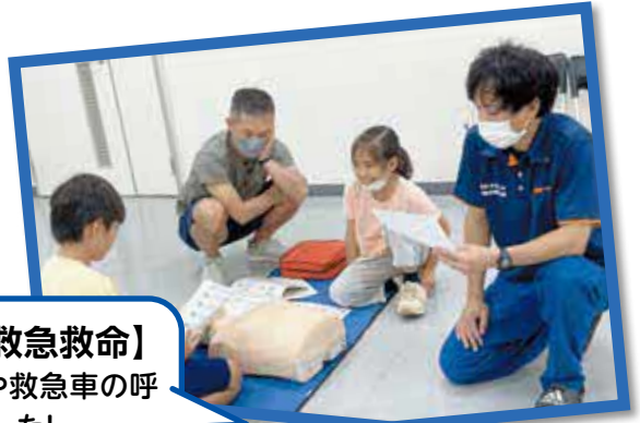
【親子で学ぶ救急救命】 AEDの使い方や救急車の呼び方が分かりました!