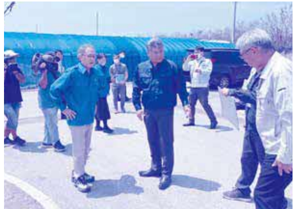
【写真左から】玉城デニー知事、久田浩也村長