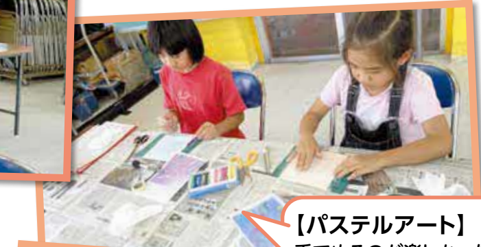
【パステルアート】 手でぬるのが楽しかった。 おえかき上手になった。