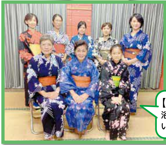
【ゆかた着付け教室】 浴衣を着る機会があまりないので勉強になりました。