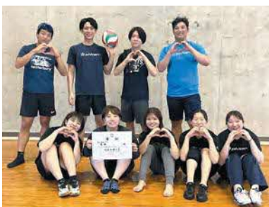
一般混合の部優勝 ミキ♡チーム