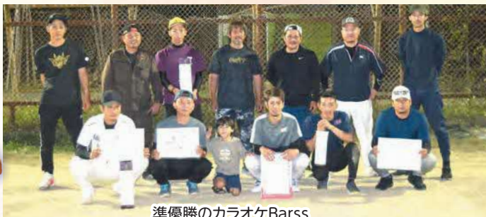
準優勝のカラオケBarss

6月11日、今帰仁村運動公園サブグラウンドにおいて、壮年ソフトボール大会が行われました。大会は、「日頃スポーツに親しむ機会の少ない壮年を対象に、順位にこだわらず、ソフトボールとおして健康、体力の保持増進、愛好者の育成と相互の親睦を図り、スポーツに親しむ」ことを目的としています。