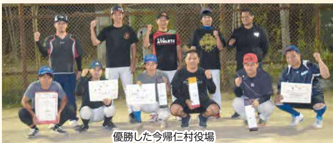
優勝した今帰仁村役場