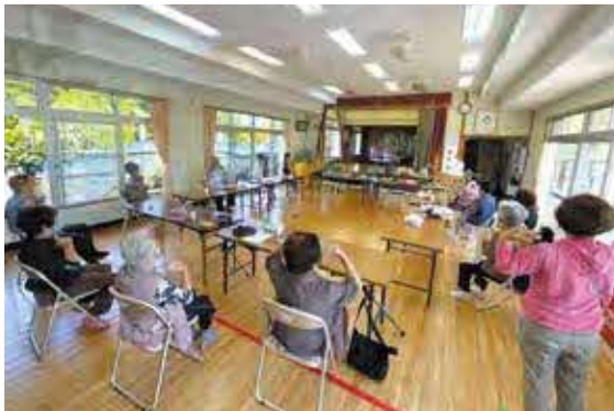
兼次区(毎月第2・第4火曜日10時~11時)

今帰仁村では地域住民が主体となって、介護予防のための運動教室が定期的実施されています。今月号では、それぞれの地域での活動の様子を写真でご紹介します。