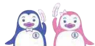
更生ペンギンの ホゴちゃんとサラちゃん

社会を明るくする運動への理解を深めてもらうために、デジタルサイネージを活用した情報発信やのぼりなどを設置します。