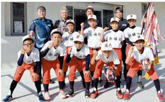
◀ 役場へ準優勝報告に訪れた今帰仁ジュニアのメンバー

決勝では名護市のチームに9-8で惜しくも敗れ、準優勝となりました。今帰仁ジュニアは、令和5年7月28日～8月2日に高知県で開催される第12回龍馬旗争奪西日本小学生野球大会への派遣が決まっています。次の大会も頑張ってください。