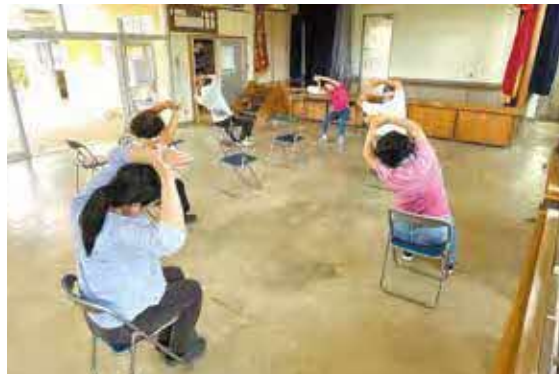
越地区(毎週火曜日10時~11時)