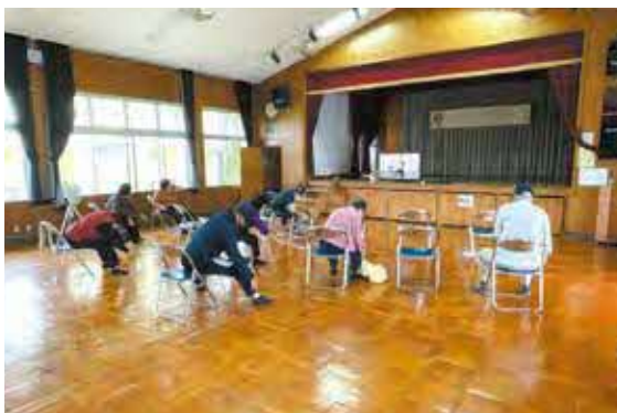
仲宗根区(毎週水曜日10時~11時)