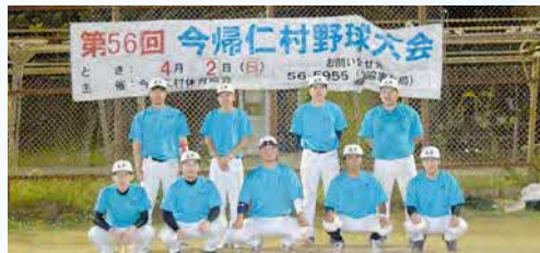
▲準優勝 大井ベースボール