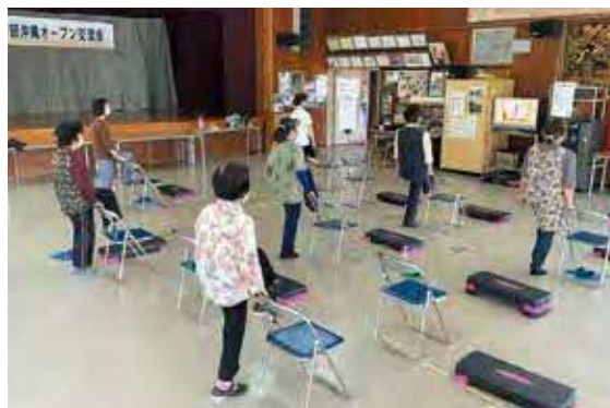
湧川区(毎週火曜日14時~15時)

※開催の日程・時間等は変更となる場合があります。詳しくは各公民館にお問い合わせください。