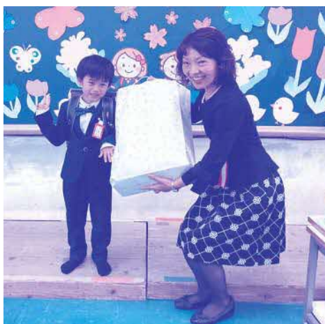
▲今帰仁小学校 新一年生

今年度は、兼次小学校21名、今帰仁小学校49名、天底小学校29名が入学しました。新一年生のみなさん、これから6年間楽しい学校生活を過ごしてください。