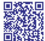
総務省消防庁QRコード