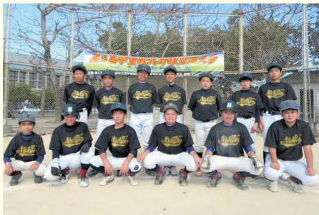
▲今帰仁村選抜チームのメンバー

3月、第14回美ら島学童軟式野球大会が開催され、今帰仁村内3小学校の6年生で構成する、少年野球の今帰仁村選抜チームが出場しました。本大会は、小学校の大会を終えた県内の小学6年生の居場所づくりや、中学校野球に向けた技術向上などを目的とした交流大会です。