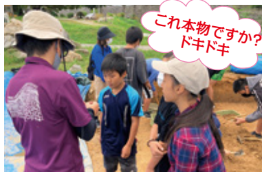
これ本物ですか? ドキドキ