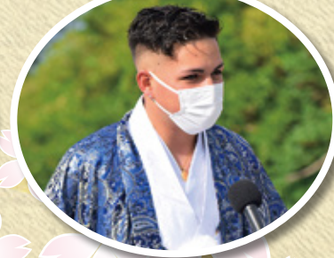
メッセージリレーでそれぞれの想いを語り繋いだ4名