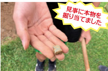
見事に本物を掘り当てました