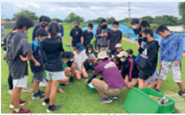
▲館長の説明を真剣に聞きます

世界遺産今帰仁城跡での発掘体験。自身の手で歴史に触れ、地域の理解を深める有意義な時間となりました。