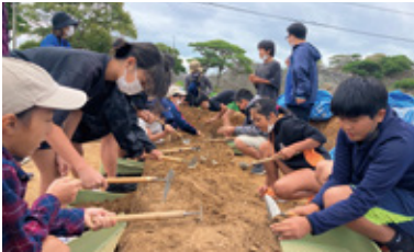
▲いざ!発掘スタート