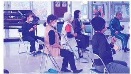
▲脳トレを交えて頭もリフレッシュ