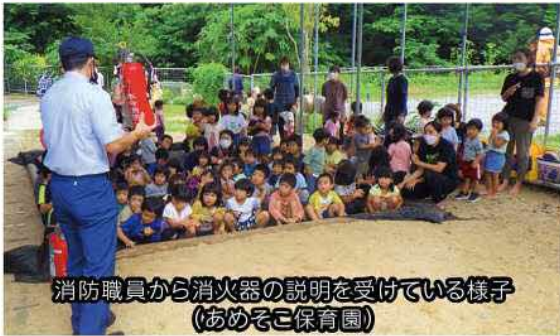
消防職員から消火器の説明を受けている様子 (あめそこ保育園)