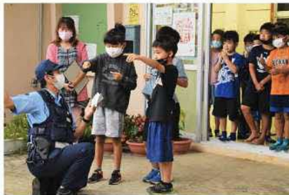
▲崎山公民館での防犯訓練