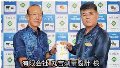
有限会社 丸吉測量設計 様