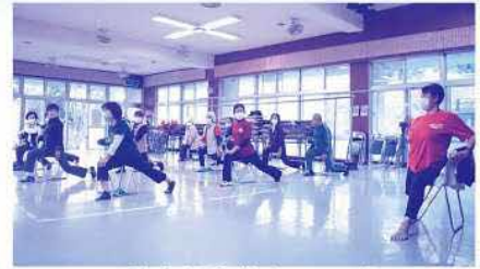
▲貯筋運動教室スタート!

参加者らは、「普段の生活がとても楽になった」「みんなで集まって運動するから楽しい」と笑顔で話していました。