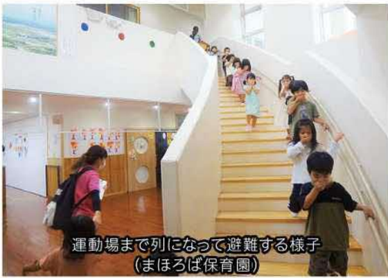
運動場まで列になって避難する様子 (まほろば保育園)

はじめに、消防職員が避難経路の指導や消火器の取扱方法などを説明しました。園児たちは「お・か・し・も・ち」を意識した避難の大切さや、火災の恐ろしさについて消防職員の話に真剣に聞き入っていました。避難訓練では、先生の指示にしっかりと従い、上手に避難することができました。