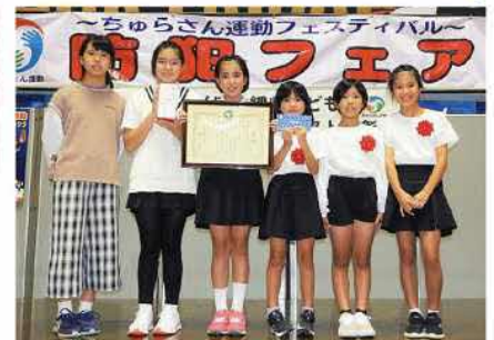
▲表彰された「手をつないですすめ隊」