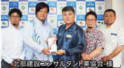
北部建設コンサルタント業協会様