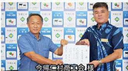
今帰仁村商工会 様