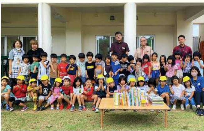
▲贈呈式(まほろば保育園)に参加した園児らと一緒に♪