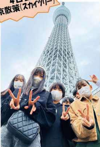
4日目 東京散策(スカイツリー)

な仕事場でした。生徒たちは真鍮の選別とステンレスの選別作業の体験。あつという間に作業に慣れた生徒たちは「作業楽しい」と言いながら、仕分けていました。4日目、最終日は東京散策を楽しみながら、街中の様々な仕事を観察するという研修を行いました。生徒たちは、いろいろな仕事や働く人々を見る中で、仕事における「かかわる力」の重要性に気づいたようです。 今帰仁村出身の方々が県外で活躍する姿を見て、生徒らは嬉しい気持ちと同時に、たくさんの方々の刺激を受けたことでしょうか。貴重な体験となりました。