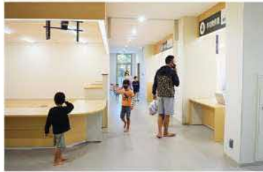
▲1階窓口カウンター付近

令和5年1月4日からは、新庁舎にて業務を開始します。皆さまどうぞよろしくお願い致します。