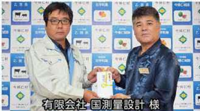
有限会社 国測量設計 様