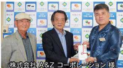
株式会社 A&Z コーポレーション 様