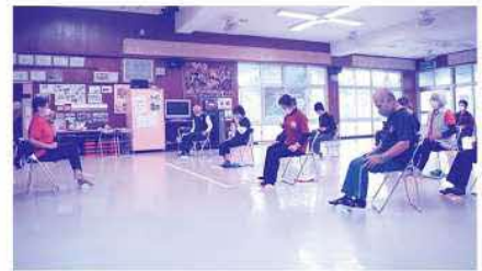
▲青竹を使った外反母趾トレーニング