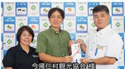
今帰仁村観光協会 様