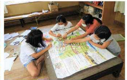
▲マップづくりの様子