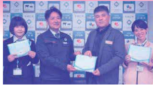
JAおきなわ今帰仁支店 様