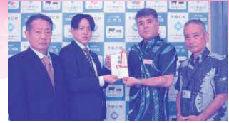
株式会社ロイヤルコーポレーション 様