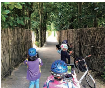
▲美しい景色が広がります