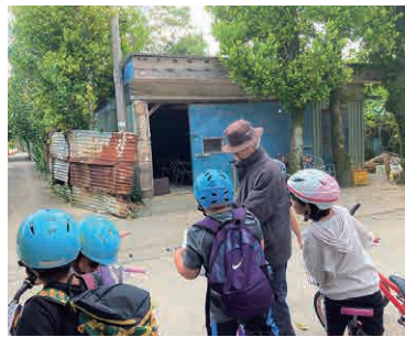
▲地域の人から情報収集♪