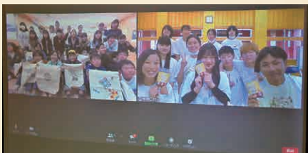
届いた特産品を見せあう子どもたち。 「美味しかったよー!」「大切に使いまーす!」