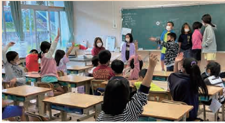
▲学びたいことを児童たちで話し合います