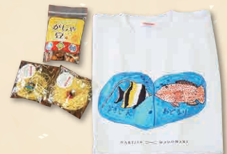
和泊町・知名町の子どもたちが作った がじゃ豆・美ら玉・Tシャツ