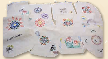
村ジュニアリーダーが作った 紅型のトートバッグ

今年度は互いの特産品を紹介しあうことを企画。今帰仁村は「紅型染め」のトートバッグ、和泊町・知名町は黒糖を使った豆菓子「がじゃ豆」などを紹介しました。事前に三町村の子どもたちが自ら作った特産品を交換し、オンライン交流会で特産品の詳細や作成の様子など、写真を使って説明しました。オンラインでの交流に、はじめは緊張気味の子どもたちでしたが、アイスブレイキングなどのレクリエーションを通して互いの緊張は徐々にほぐれ、「早く会いたいね」「来年こそは遊びに行くからねー！」と大盛り上がり。笑顔の絶えない充実した交流会となりました。