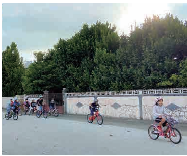
▲自転車学習サイコー!!

1学期に社会科の授業でマイクロバスに乗り、村内19の字を巡る学習をしました。歩いて学校周辺の散策もしました。「マイクロバスと徒歩以外で移動する方法はないかな?」と先生がそれとなくヒントを与えると、児童たちから「自転車!」という案が出てきました。 話し合い活動をリードする児童が「自転車で行きたい人?」と聞くと沢山の手が挙がります。自転車に乗って、今泊区の探索に行くことが決まりました。探索の前に、今泊のことを学ぶ事前学習も行いました。