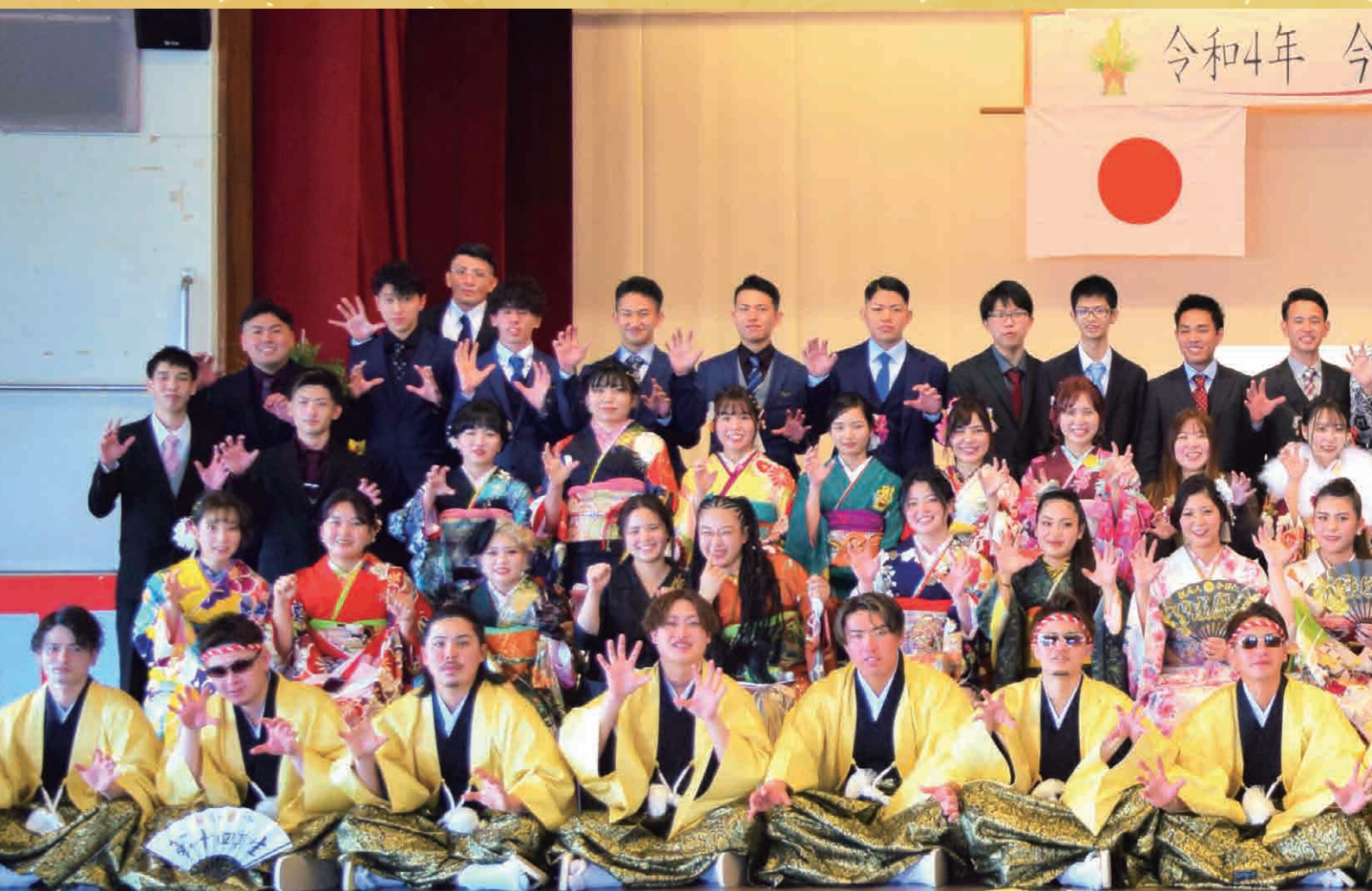
※全体写真撮影時のみ、マスクを外しています。