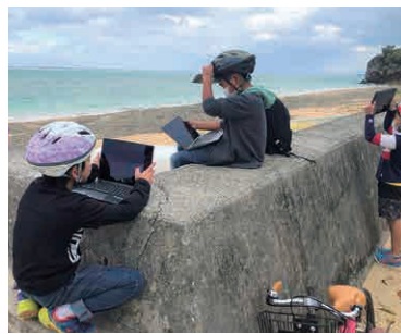
▲海辺で一休み。「写真整理しよう」

探索当日は天気にも恵まれ、自転車での学習という初の試みに児童たちは嬉しそうな表情です。安全確保のため、ヘルメットを装着し、保護者や教育委員会の職員が班ごとに2名ずつ付きます。校長先生や在校生に見送られ、ドキドキの授業がスタートです。探索にあたって、先生はいくつかのミッション(任務)を準備しておきました。それをクリアするために、地域の人から話を聞いたり、自転車の安全な乗り方を学んだりします。 今泊区には二つの神アサギがあります。その写真を撮影するのが第1のミッションです。そして第2のミッションは石敢當の撮影をすることです。一番多く見つけた班は36ヶ所の石敢當を撮影できました。2つのミッションを達成することで、今泊集落が他の集落(シマ)と作りが違うことが分かります。 日々の生活の中で気にも留めなかった部分に目を向けることで、様々な気づきや発見があります。学校に戻ってから「他の地域のことも勉強したい!」と興奮冷めやらぬ3年生でした。