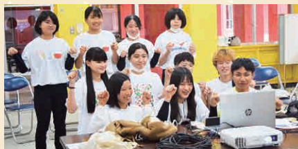
村ジュニアリーダー考案ダンス 「チャチャラブ」で交流を深めます