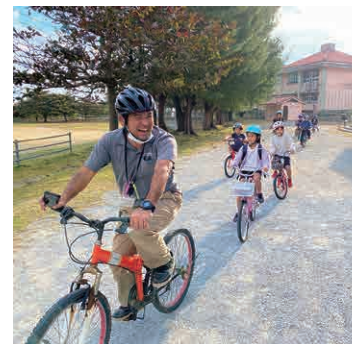
▲いざ今泊へ!いってきま〜す!