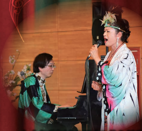
大人気「鬼滅の刃」の曲も披露! 衣装もバッチリで子どもたちは 大盛り上がり♪