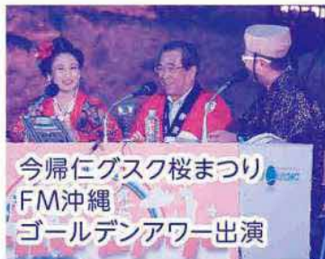
今帰仁グスク桜まつり FM沖縄 ゴールデンアワー出演