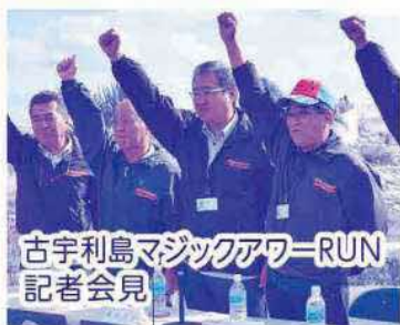
古宇利島マジックアワーRUN 記者会見