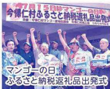
マンゴーの日 ふるさと納税返礼品出発式