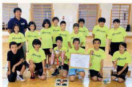
優勝おめでとうございます!

第106回国頭地区ミニバスケットボール交歓会夏季大会が行われ、天底小ミニバスケット部が混成の部で見事優勝しました。