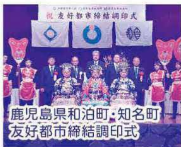
鹿児島県和泊町・知名町 友好都市締結調印式