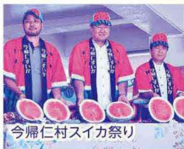
今帰仁村スイカ祭り