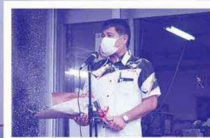
初登庁セレモニー 挨拶の様子