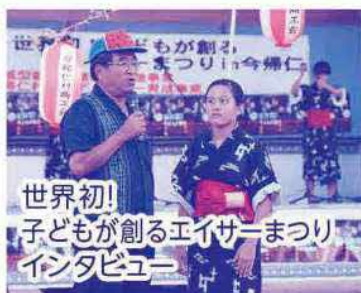
世界初! 子どもが創るエイサーまつり インタビュー