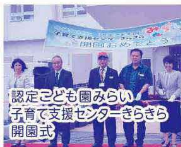
認定こども園みらい 子育て支援センターきらきら 開園式