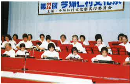
▲琴生流今帰仁教室による大正琴の演奏