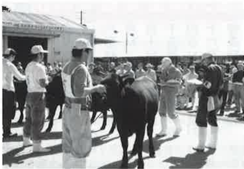
▲体型などの審査が行われた北部地区畜産共進会