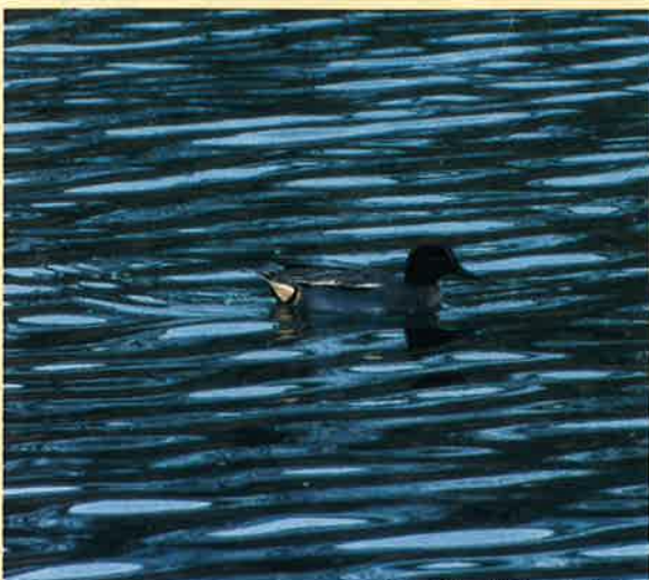
観察地：村内の河川、池