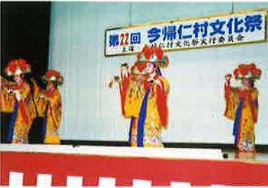
▲与那嶺区民が四つ竹を披露

コミュニティセンターでは二日間にわたり舞台発表が行われ、村内の舞踊研究所や愛好会など多数が出演、熟練した舞踊や伝統芸能を披露した。