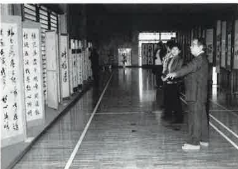
▶運天さんが入場者にていねいに説明していた書道展(手前)