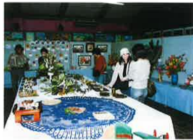
▲パッチワークなどの力作が展示された中央公民館