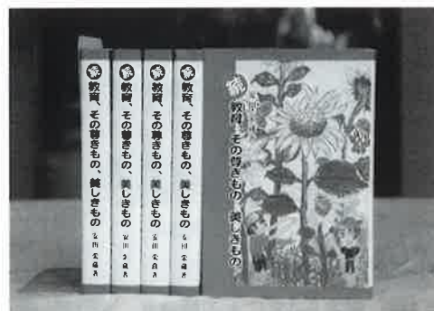
▲教え子の絵で飾られた表紙