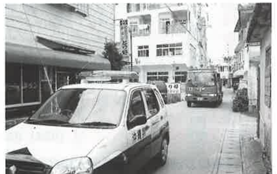
▶パトカーを先頭に商店街をパトロール

警察活動や消防署の消火活動に影響を及ぼす違法駐車をなくそうと本部警察署(今帰仁交番)と本今消防組合は、十月七日、道路環境浄化パトロールを行った。 警察のパトカーを先導に消防車も運行させながら「交通事故の原因になり、消防署の消火活動の妨げにもなる違法駐車はやめよう」と呼びかけながら仲宗根区の商店街を中心に村内をパトロールした。