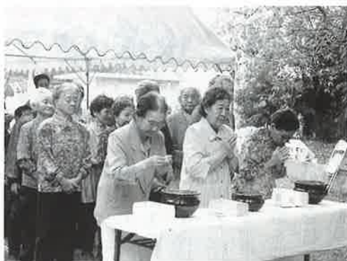
▶戦没者の御霊に手を合わせる遺族の方々