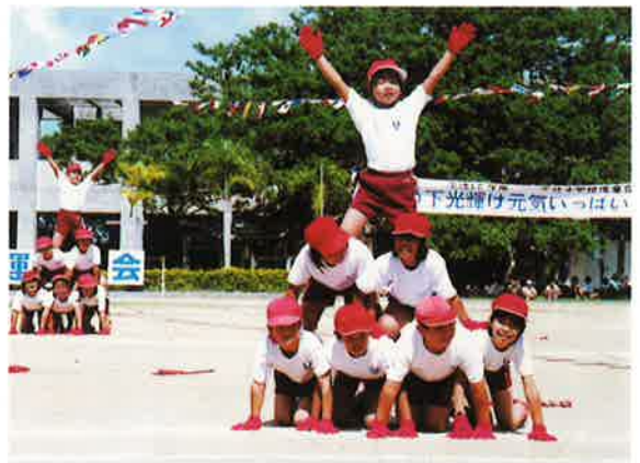
▲カッコよく決まった3、4年生の「リズム体操」 天底小学校