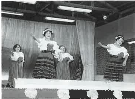
▲那覇郷友会の「詩人と私・花」