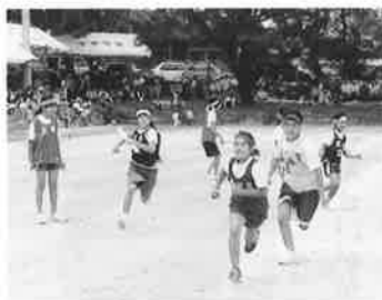
▲大会を盛り上げた 小学生リレー