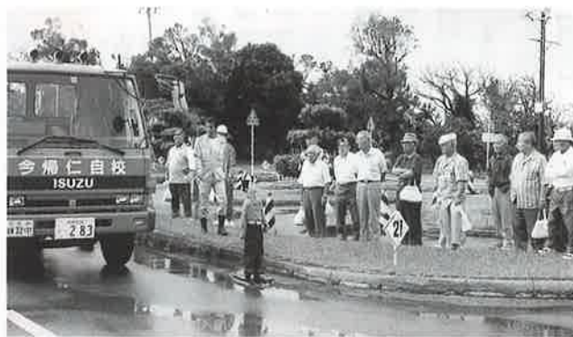
▶人形を使った巻き込み実験を見つめる参加者