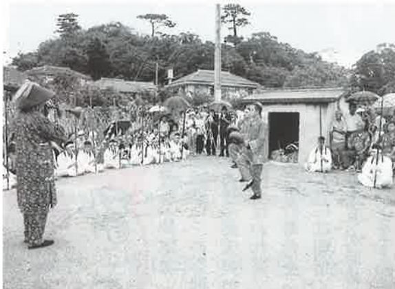
▲獅子屋で演じられた「路次楽」

その後公民館の舞台では、「特牛節」や「松竹梅」「七福神」など十七演目が次々と演じられ区民らが夜遅くまで祭りを楽しんだ。