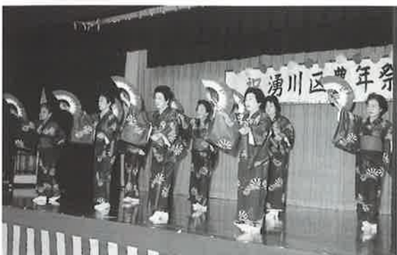
▲老人会による「初春の踊り」