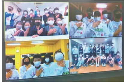
交流を楽しむ和泊・知名町の児童生徒と村ジュニアリーダー