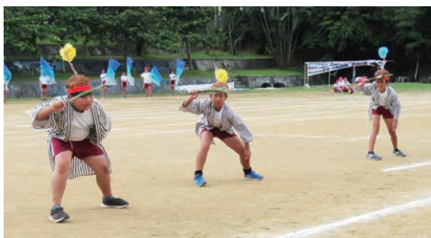
▲運動会 リハーサル