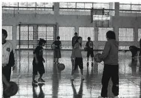
▲バスケの基本を学んだ古宇利スポーツクラブ

イラジャー」「イカ墨そば」などの新鮮な海産物を使った手料理でもてなした。フェリー乗り場で子どもたちに見送られた食楽のメ