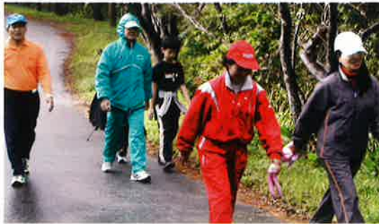
▶各自のペースでウォーキングを楽しんだ参加者

一月二日、 村主催の第一 回新春歩け歩 け大会が開かれ、 村内外から家 族連れら約四 十人が参加。 村運動公園か ら乙羽岳まで の往復十五K Mの初歩きを 楽しんだ。