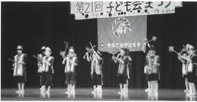
▶ 仲尾次子ども会の踊り「スンサーミー」