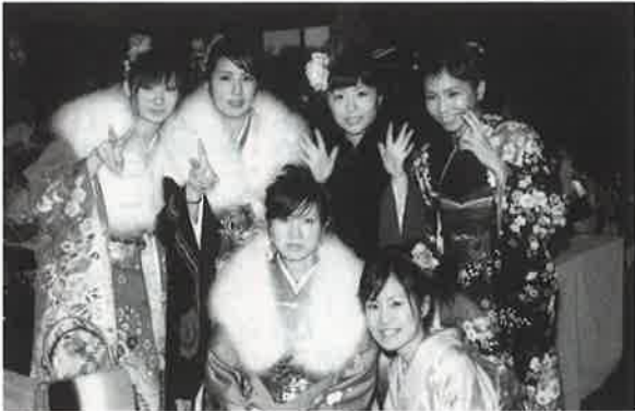
▶華やかな振り袖姿の新成人

平成十七年の成人式が一月四日、村コミュニティセンターで開かれ、一一一人(男六十一人、女六十人)が新たな人生の門出を祝った。