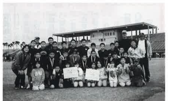
▶ 楽しみながら参加したミラクルキッズのメンバーたち

「冬場の体力作りに」と初参加したミラクルキッズは、すべての種目に出場。三・四年生の部に出場したAチームが栄冠を手にした。