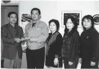
▲与那嶺村長に寄付金を手渡す 商工会員ら

これは、十二月三日に行われたチャリティーダンスパーティー(同商大会青年部・女性部主催)の募金、収益金から贈られたものです。