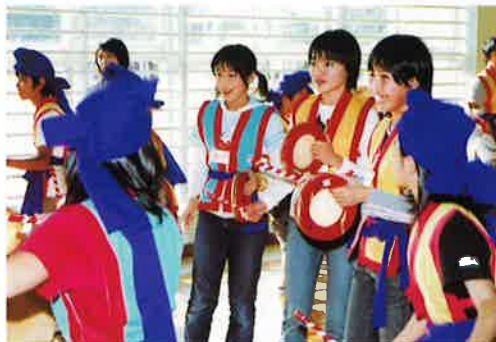
▶初めて「エイサー」を踊った酒田市の子どもたち