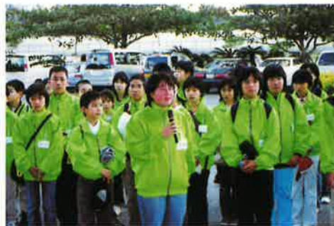
▲宿泊先の梯梧荘に到着した酒田市の子どもたち

その後、村内の家庭で宿泊し、村の子どもたちと寝食をともにして、沖縄の文化を学んだ。