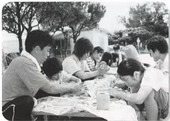
▲真剣に作品を作る親子

品を作り、もみながらなどで、翌日の朝まで焼いて仕上げするため、すべての工程が体験でき、共に喜びを味わえる。」と話し、親子は、灰皿や花瓶など思い思いに作品を作り上げ、楽しい夏休みを過ごしていた。