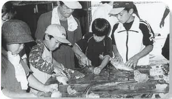
▲なれない手付きで魚をさばく子ども達

■今帰仁の豊かな自然の中で、水産業に関心を持たせ、親子の共同作業によって豊かな心を育てようと、親子体験教室「わんぱく自然探査塾」(村教育委員会、村漁協主催)が八月八日早朝、古宇利島近海と今帰仁漁港で行われた。