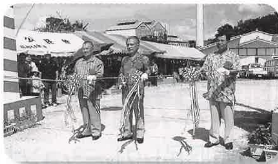
▲テープカットでまつりが始まった