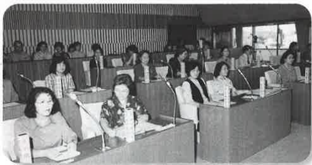
▲多彩な意見で盛り上がった模擬議会