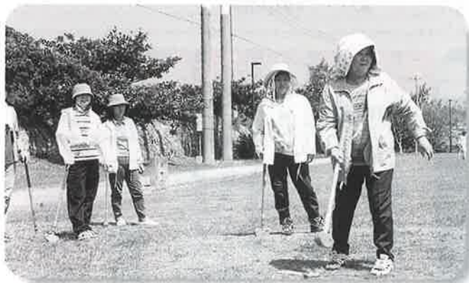
▲グラウンドゴルフで汗を流す

最後に学事奨励が行なわれ、関係者が児童生徒を激励し、文具用品などが一人ひとり手渡された。