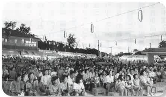
▲ステージを楽しむ観衆

●本村の夏の風物詩として定着している「なきじん乙羽まつり」が八月十・十一の両日、今帰仁の駅「そぐれ」横広場を主会場に開催された。 まつりは、闘牛大会を皮切りに琉舞や日舞、太鼓などの華麗な演舞や、大勢の村民が参加したカラオケ大会、チビッコ相撲、盆踊り、綱引き合戦など、多彩なイベントが繰り広げられ、大勢の観衆が夏の夜を楽しんだ。 その他、いまじん太鼓や青年エイサーなどの演舞や、なつメロ歌謡ショーも行われ、まつりの締めくくりには、夜空いっぱい広がる彩やかな花火に、観衆は、釘付けとなった。