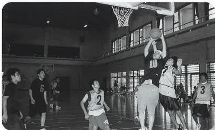
▲男子バスケットボール決勝戦