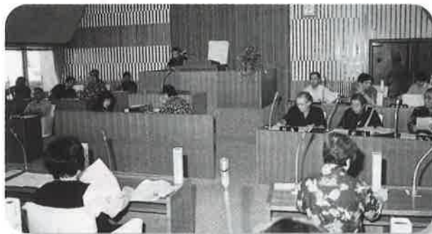
▲緊張した面持ちの村当局