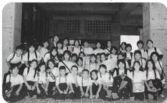
▲天底小金管バンド部