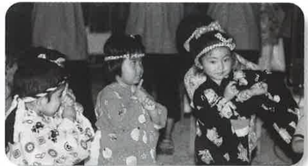
▲「おまつり忍者」を踊る子どもたち