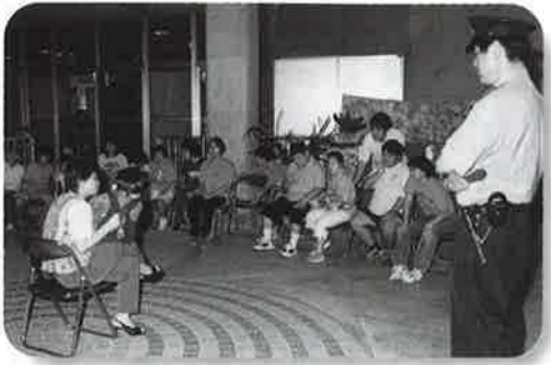
▲腹話術による指導

●おとば学園の皆さんの交通安全及び防犯意識を高め、今後の事故防止に役立てようと、八月十五日、村社会福祉協議会で、本部署員今帰仁交番員による、交通安全指導や防犯講話などが行われた。 パトカーに装備されている器具の説明のほか、警察官を身近に感じてもらうため、所持している手錠や警棒の披露の後、腹話術による交通安全の指導が行われた。