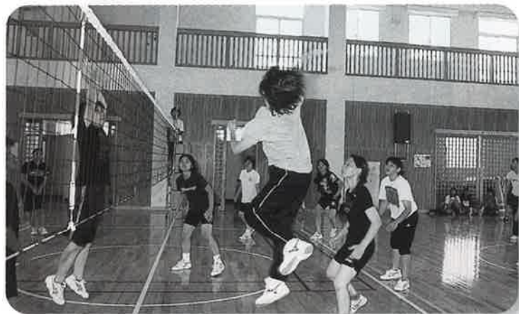
▲女子バレーボール決勝戦

●本村の夏の風物詩として定着している「なきじん乙羽まつり」が八月十・十一の両日、今帰仁の駅「そぐれ」横広場を主会場に開催された。 まつりは、闘牛大会を皮切りに琉舞や日舞、太鼓などの華麗な演舞や、大勢の村民が参加したカラオケ大会、チビッコ相撲、盆踊り、綱引き合戦など、多彩なイベントが繰り広げられ、大勢の観衆が夏の夜を楽しんだ。 その他、いまじん太鼓や青年エイサーなどの演舞や、なつメロ歌謡ショーも行われ、まつりの締めくくりには、夜空いっぱい広がる彩やかな花火に、観衆は、釘付けとなった。