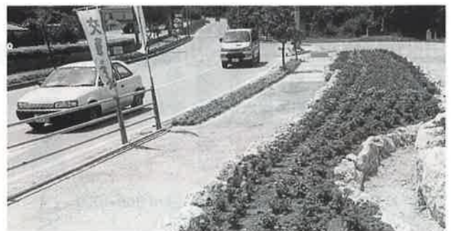
▲道ゆく人の目を楽しませる花 (役場前交差点)

この事業は、村内の美化浄化対策の一環として、今帰仁城跡道路周辺の清掃及び花の植栽、また役場前の交差点にも花壇づくりを通して、きれいで美しい今帰仁村の観光振興を図ることを目的に、OCVB (沖縄観光コンベンションビューロー) や村補助を受けて村商工会によって施工されました。