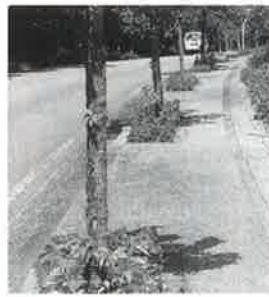
▲花で訪れる人を温かく迎える (城跡入口)