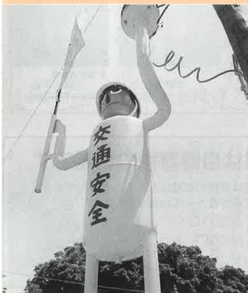
▲交通の安全を見守る人形