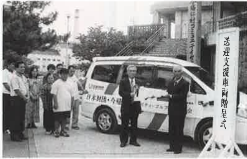
▲新車の前で喜ぶ職員たち

社会福祉協議会が 送迎車を導入 日本財団よりの助成と村チャリティーゴルフ大会の寄付金等を活用し、村社協へ送迎支援車が配車された。 日本財団では社会福祉の増進に寄与し誰もが安心して暮らせる地域社会づくりのため福祉車両の支援を行っている。