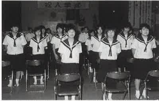
▲兼次中学校の入学式