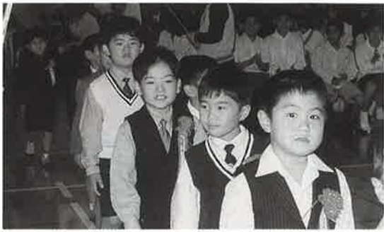
▲今帰仁小学校の入学式

村内七つの小中学校で四月八、九の両日入学式が行われ、小学校一〇七人、中学校二四四人の新生が入学しました。 今帰仁小学校では、在校生や先生、父母など大勢の方々の拍手で迎えられ入場、校長先生や生徒会代表の歓迎のあいさつがあり、その後新生一年生全員で「二年になったら」の歌を大きな声で歌っていました。