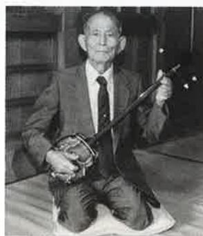
▲三線の音色が「心をおちつかせる」と話す要八さん

二、三時間も草むしりに励むこともあり「やりすぎてしょっちゅう嫁に怒られているさ」と笑顔を見せる。楽しみにしている週二回のデイケアでは「フロも入るし、昼寝もする。体操もあって最高!」と話し、家で