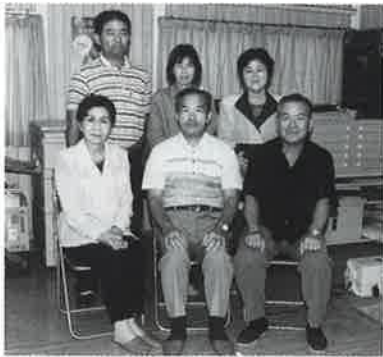
▲事務局をあずかる新執行部の皆さん

同だよりは年二回発行され、今後、学校の活動状況や同窓会及び地域の状況など新鮮な情報を会員に提供していく。