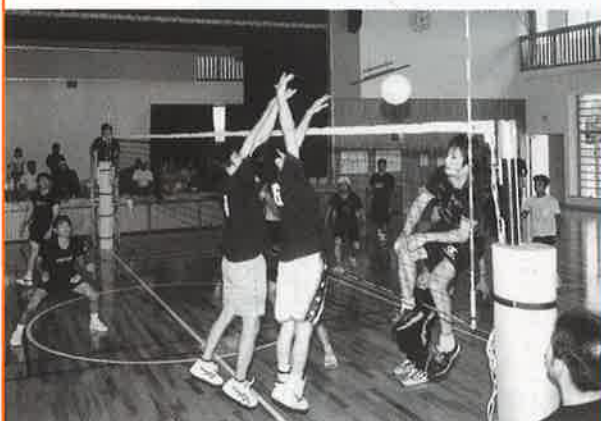
▲各会場で熱戦が繰り広げられた村球技格技大会

カと技がぶつかり合う「村民スポーツの祭典」第五十七回今帰仁村球技格技大会が八月六日、村運動公園を主会場に開催された。今年も各字の精鋭たちがそれぞれの種目で日ごろの練習の成果をいかに発揮し白熱した試合を繰り広げるなか、選手層の厚い湧川チームが全六種目中、四種目で決勝戦にコマを進めるなど、総合の部で二位に九点の大差をつけ三年連続で総合優勝に輝いた。なお、各種目ごとの成績は次のとおり