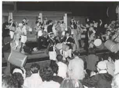
▲観客も一体となってまつりは最高頂に

太鼓と琉球舞踊をアレンジした子ども芸能団、琉舞道場の一行四十一人が八月五日、山形県・酒田市の「国府の火まつり」に招待され、華麗な琉球の舞と勇壮な太鼓を披露し観衆を沸かせた。 会場となった国指定の史跡の「城輪柵跡」では幽