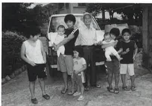
▲いつもひ孫たちに囲まれ笑顔を浮かべる要八さん