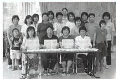
▲ハンドブックの完成を喜ぶ保健推進員の皆さん

母子の健やかな成長をサポートする「村母子保健推進員」の皆さんがこのほど、「育児ハンドブック『たんぽぽ』」を発行した。このハンドブックは昨年、推進員が実施し