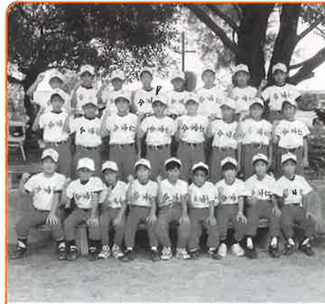
▲やればできる！手ごたえをつかみ大きく成長

七月の福岡大会。そして八月には沖縄大会と二つの九州地区少年野球大会に県代表として出場し、好成績を収めた今帰仁ジュニアのメンバーが八月二十二日、村役場に村長を訪ね