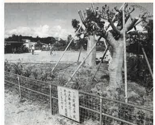
▲殺伐とした公園に緑がよみがえった