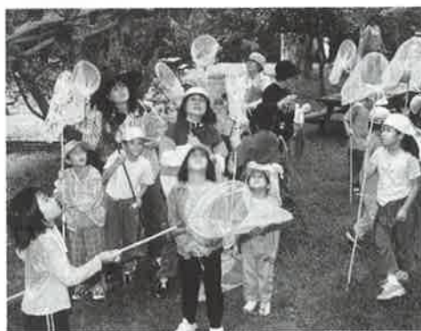
▲親子で夢中になった昆虫観察会

か、伝統芸能「七福神」が始まると、福をもたらす七人の神々の優雅な舞をひとめ見ようと大勢の観客が詰めかけた。湧川区と知名町との交流は九年前の第一回目の同夏まつりに湧川青年会のエイサーが招かれたことがきっかけで、そのときの湧川エイサーの迫力ある演舞に感動した知名町の若者らが島にあわせた曲や踊りを取り入れエイサーの活性化を図り、現在でも島内各地で盛んに演じられている。