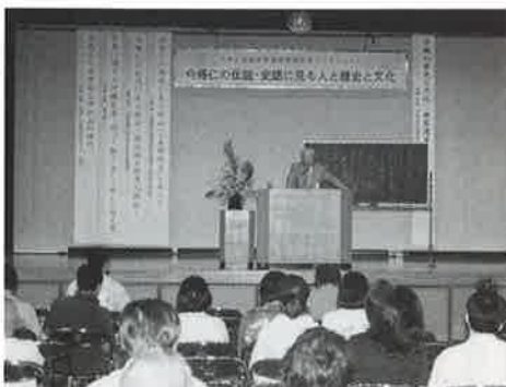
▲村内外から多くの人が詰めかけたシンポジウム