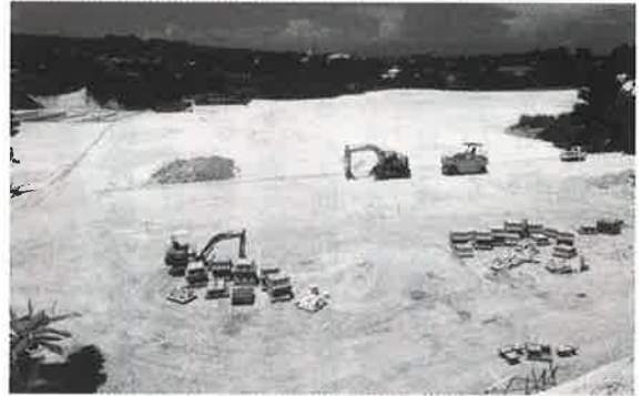
▲造成工事も完了し、いよいよ校舎着工へ