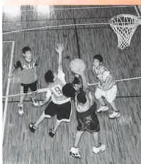
▲ゴール前での激しい攻防!

て初優勝を飾り、また、女子決勝は今泊チームと兼次・諸志チームが二年連続して決勝で顔を合わせるなか、前半は両チーム互角の戦いを見せたものの、後半に入ると体力で勝る今泊チームがシリシリと差を広げ、三連覇を果たした。