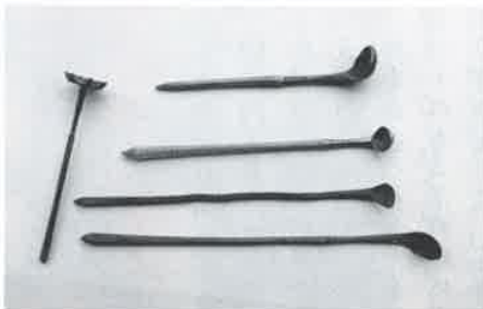
▲寄贈いただいたカンザシ 左側の1本が髪差、四本は押差

普段の生活から姿を消してしまった髪結いに差すジューファーです。寄贈いただいたこの機会に五本のジューファーを展示しましたので、是非御覧ください。