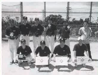
▲ハッスルプレーで乱打戦を制した遊佐組の精鋭たち