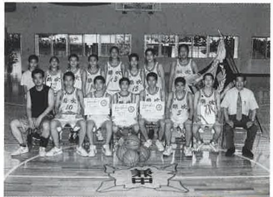
▲県大会でも健闘を誓う兼中男子バスケ部

いる字行事の一つとあって、この日も大勢の家族連れが参加、用意した玉入れ競争やリム回し、民踊などの多彩なプログラムに参加者らは、さわやかな汗を流していた。 また、運動会終了後は、公民館において懇親会が行われ、