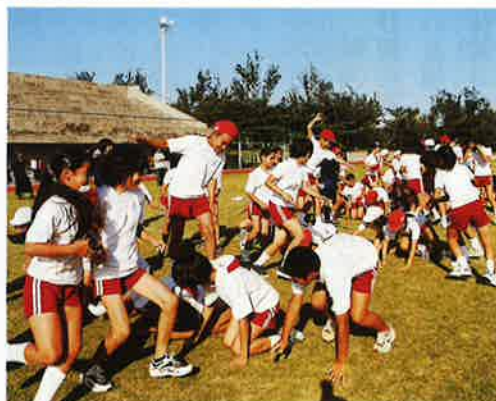
▲各学校の子ども達が入り混じってゲームを楽しむ

平成十五年の村内中学校統合に向け、五つの小学校六年生の児童が期待と希望をもって中学校に入学できるよう、レクやスポーツをとおして交流を深める六年生交流会が二月八日、村運動公園ホッケー場で行われた。 この交流会は、中学校生徒会役員と小学校児童会役員らが実現。この日は、中学生執行部のリードのもと、全小学校の六年生、百五十二人が十二チームに分かれ、一枚の新