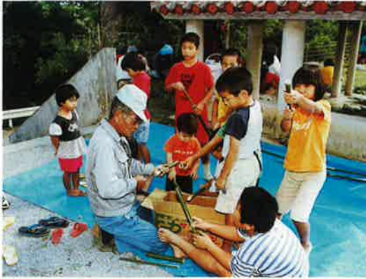
▲おじいちゃんの回りには、いつも子ども達の輪ができた