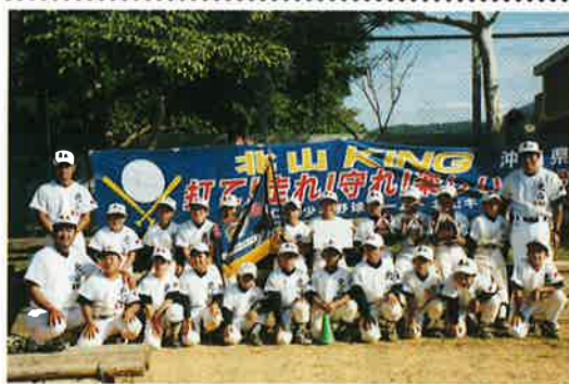
▲三大会ぶりの優勝を飾った北山キングチーム