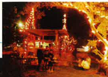
幻想的な光のオブジェに誘われ散策する人も

には多くの家族連れが訪れた。参加者のカウントダウンにあわせてイルミネーションが点灯されると音楽とともに幻想的な光のオブジェが表れ、歓声とともにクラッカーが鳴り響いた。 また、この日は一足早くやってきたサンタさんから、参加者全員にお菓子が配られ、