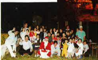
サンタさんとの記念撮影