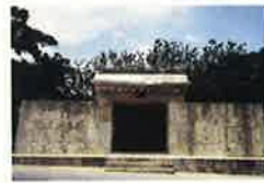
▲園比屋武御嶽石門