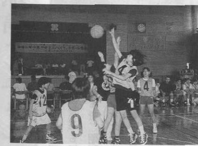
▲躍動感あふれるプレーを演じる子どもたち

優勝おめでとう。兼次・諸志のミニバスケットボールチームが六月二十三日、兼次小体育館で行われた「第二十回村少年少女ミニバスケットボール大会」においてみごと男女アベック優勝を飾った。 大会には男子十二チーム、女子八チームが出場、各チ