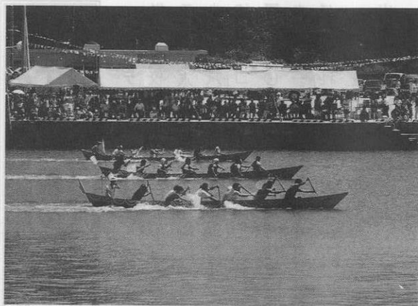
▲大観衆の声援を受けスタートダッシュ

航海の安全と豊漁を祈願する海人(ウミンチュ)最大の行事海神祭が六月七日、運天漁港で開催された。この日は日曜日とあって会場は多くの家族連れで例年以上に盛り上がり、御願パリーから職域対抗レースまで、懸命に権をこぐ海の男たちの勇姿に、詰め掛けた観衆から