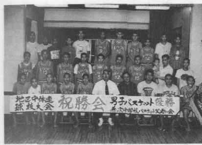
▲優勝おめでとう この感激をもう一度県大会で