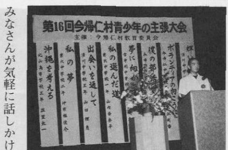
▲地区代表目指し意見発表する弁士

その関係で中一の春休みに、一度だけおとば学園のボランティアに行ったことがあります。初めて行った時は、ためらいと抵抗がありました。でも学園の中に入っていると、職場の方々と障害者の