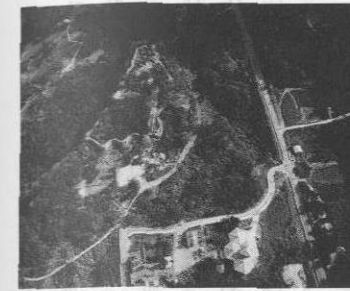
▲上空から見た今帰仁城跡

世界遺産の登録について 去る、五月二十六、二十七日の両日の臨時議会において「今帰仁村歴史文化遺産の環境確保に関する条例」が可決された。この条例は、今帰仁城跡の世界遺産登録に必要な緩衝地帯を設定するために制定されたものである。 世界遺産条約がユネスコで採択されて四半世紀が過ぎ、日本が一九九二年に加盟してから六年が経過している。この間、世界遺産の制度は世界各国から高い評価を受けており、すでに世界の多くの国が加盟。登録された遺産の数は五五二カ所(一九九八年一月現在)を数えている。 日本の文化遺産登録の経過は加盟以来、一九九三年には「法隆寺地域の仏教建造物」と「姫路城」、九四年には「古都京都の文化財」、九五年には「白川郷・五箇山の合掌造集落」、そして九六年には 「原爆ドーム」と「厳島神社」と順調に登録を受けてきた。琉球王国時代の文化遺産は、国内的・世界的にみても特色があり、「世界遺産一覧表」へ早期に登録する必要がある。今帰仁城跡を含む県内のいくつかの城を「琉球王国の城・遺産群」として世界遺産一覧表に登録することにより、村内ばかりでなく、県内・国内ひいては海外にいる多くの県人に誇りと自信を与え、増加が見込まれ、本村の観光振興に大きく貢献するものと期待される。