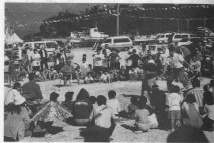
▲熱戦を展開するちびっこずすもう

消防団、一城建設、運天クラブの三チームが激しいデッドヒートを繰り広げ、折り返しからのラストスパイクで一城建設に軍配が上がった。また、ハーリーに続いて各字対抗ちびっこずすもう大会、さかなつかみ取り、一般角力大会なども行われ、会場は夜遅くまで