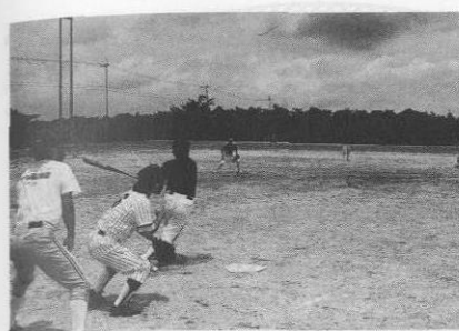
▲アレッ ボールが消えた そんなバカな!