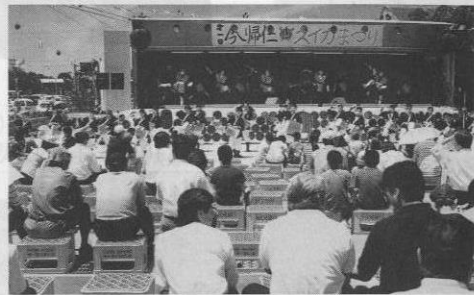
▲多勢の人が繰り出しにぎわったスイカまつり

ブランド化された「なきじんスイカ」のイメージアップを図り全国にPRする目的で五月二十三、二十四の両日、このほど完成した「今帰仁の駅 そーれ」を主会場に第一回今帰仁スイカまつり(主催 同実行委員会)が開催された。