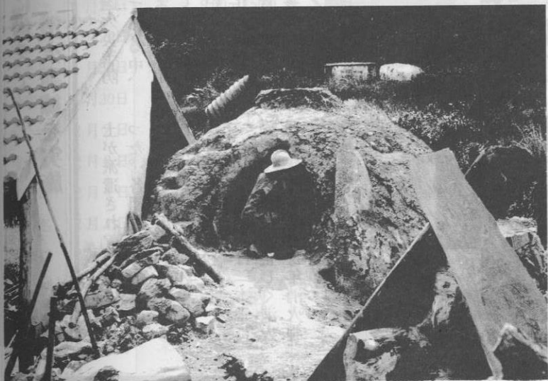
▲ペーヤチガマに石を積み込む (昭和32年~35年)

今帰仁村にペーヤチという屋号やペーヤチガマの小地名がある。ペーヤチは石灰焼きをしていた家、ペーヤチガマは石灰を焼く窯のこと。ペーヤチ窯に入れられた真石や平珊瑚は二昼夜焼かれイシベー(石灰)になる。