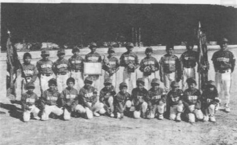
▲優勝した天底チームのうれしそうな顔・顔・顔

大会には村内から三チームが出場、クジ運悪く一、二回戦で村内同志の星のつぶし合いとなり、天底が準決勝に駒を進めた。準決勝、決勝は十一月三十日、本部小グラウンドで行