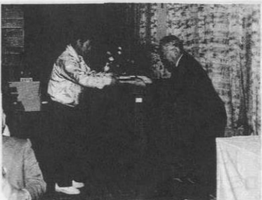
▲また来年も頑張ってください!

平成九年度の納税表彰式が十二月八日、村中央公民館で開催され、各字区長、関係者多数が出席した。