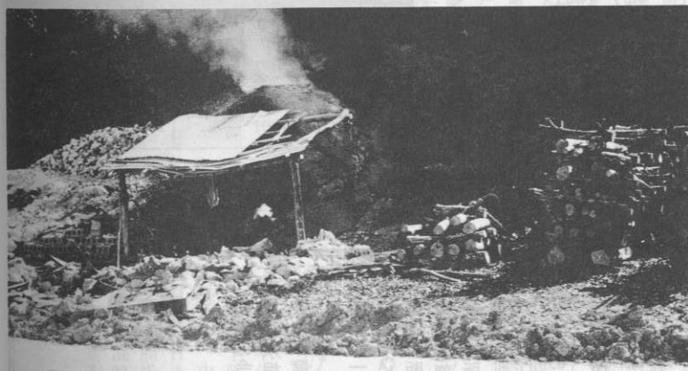
▲ペーヤチガマと回りの様子 (クリスマン氏提供、昭和32年~35年)

和土がある。白三和土は石灰に食塩やスナヅルを入れて水でこねたもの。墓の表面を塗るのに使われた。赤三和土は石灰に赤土と食塩・スナヅルを水でこねたもので主に井戸