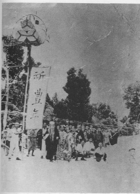
▲昭和22年(1947)の道ジュネー

今帰仁村の一番西側に位置する今泊、昭和四七年に今帰仁と親泊が合併した歴史をもつ字である。それ以前の明治三十六年に合併したことがあり、その後分離し、再び合併したのが昭和四十七年である。そのように合併や分離を繰り返している字であるが、祭祀や豊年祭は合同で行っている。豊年祭は五年マールの行事で、戦後は昭和二十二年から再開された。