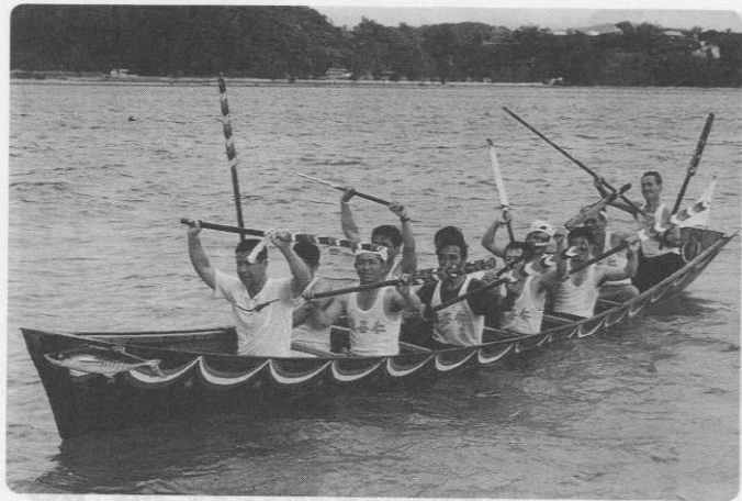
二週間の練習の成果が実り優勝を果たした渡喜仁消防団

漁協組合員による御願パリーに続き、職域パリーには、上運天消防団、漁協ウニ部会、渡喜仁消防団、運天クラブ、(株)上原興業、(株)部製糖、商工会青年部の七チームが出場し、熱戦を展開した。その結果、決勝に上位三チームが進出。昨年、初出場で優勝した渡喜仁消防団