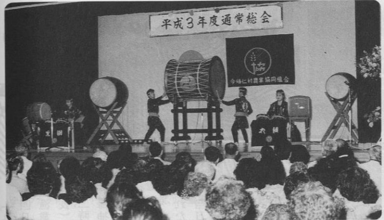
平成3年度通常総会

平成二年度の事業実績では指導、信用、共済、購買をはじめ販売、利用事業もほぼ計画どおり目標を達成し、順調に業績を伸ばしている。まず信用事業では、貯金額が九三億二千七百万円で、前年度に比べ八億五千二百万円増となっている。次に共済事業は新契約目標二九億円に対し、三二億一千百