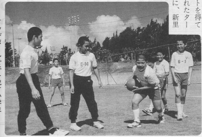
ドッチボールで汗を流す小学生

教育委員会では、「健康とふれあいの和をひろげよう」をテーマに、第七回今婦仁村レクリエーション大会を、五月二十六日午前九時より、総合運動公園で開催した。大会は、若夏の青い空に入道雲の白が映えるさわやかな天気の中で、三歳から八十代までの老若男女、多数の参加を得て行なわれた。グラウンドゴルフ、ペタンク、ターゲット