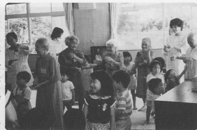
保育園児との交流で、より充実するデイサービス事業

を基本にサービス活動を行っている。このような中で、二十一世紀の福祉社会を担う子供たちの福祉教育の一環として、保育所の園児とデイサービスセンターに通う高齢者の交流会が実施された。六月三日午前十時三十分から仲尾次保育所で行われた交流会は、園児全員による歓迎の歌「ア