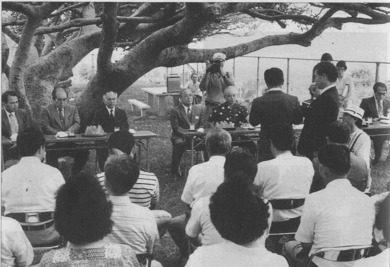
▲古宇利小中学校校庭での広聴会

平成3年5月3日現在 男4,730人(-16) 女4,853人(+5) 世帯数3,075(-1) 村の人口9,633人(-11)