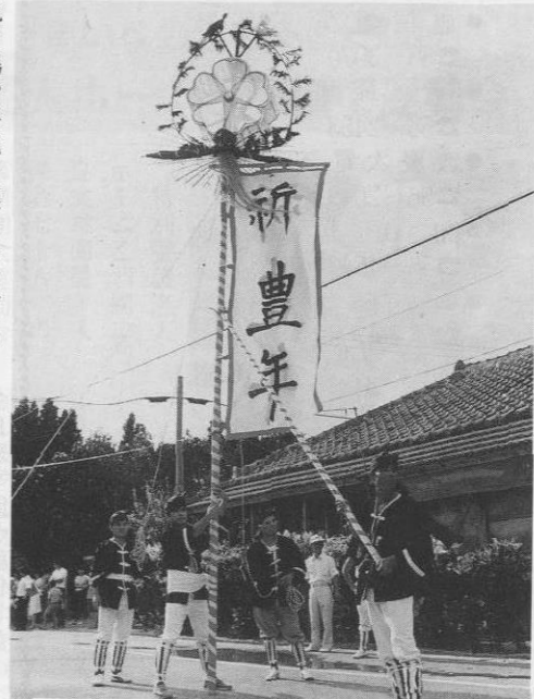
▲昭和62年(1987)の道ジュネー