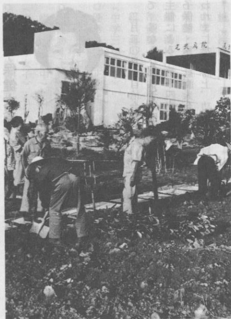
▲病院に植樹する今泊老人クラブの皆さん