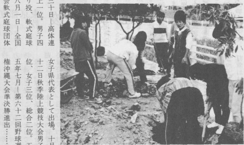
▲計画的に進められている植樹

来まで不便をかこつてきたグラウンドが、次年度には四、五三、八平方メートルに拡張される。さらに東側敷地一、七八一平方メートルも拡張され、緑化事業が進められる予定だ。