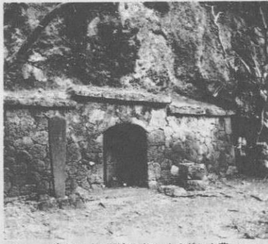
▲ピシチガ下流にあるイチグシク墓

イチグシク墓は、崎山部落と平敷部落の境介をなしている「ピシチガ」下流にある古い墓である。一帯は「ナトウ」と呼ばれ、テーで築き表面を漆喰で固めて、片屋根の軒先裏は垂木の形を模した割込がなされている。墓の出入口は石灰石をアーチ状に削って築いた大変立派な墓である。橋下の対岸に築かれ、架橋によって容易に渡ることが出来る。 墓の構造は涯面を掘り込み屋根上部を片流れにしたもので、入口となっている屋根の部分は一段と高くこさえてある。周りを亀甲乱れ積（アイカタ積）の石積で築き表面を漆喰で固めて、片屋根の軒先裏は垂木の形を模した割込がなされている。墓の出入口は石灰石をアーチ状に削って築いた大変立派な墓である。橋下の対岸に築かれ、架橋によって容易に渡ることが出来る。