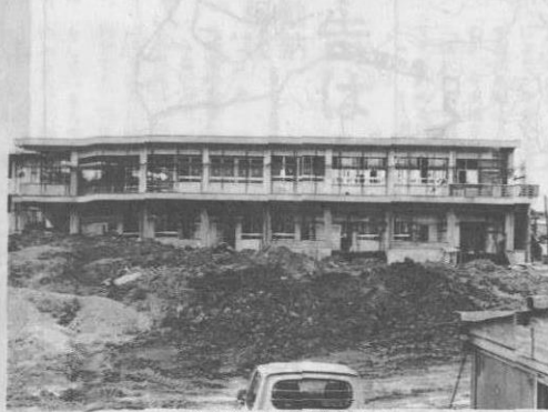
▲今帰仁中学校特別教室

今帰仁小学校の正門東側では、鉄筋コンクリート平屋建て、三三五四平方メートルの校舎建設が行なわれています。総工費は、四