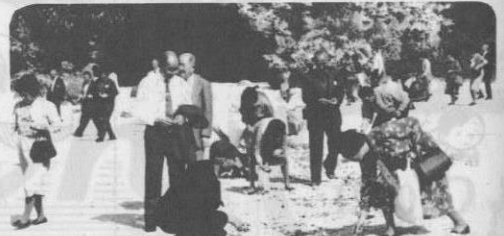
▲与那嶺長浜で貝拾いを楽しむ保養団