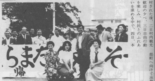
▲お別れにミス酒田を囲んで……

これまで参加された方は南国沖繩で保養をしながら心身の健康を養い、また村民の温かい接待に感激されこのプログラムを高く評価しています。さらに、昨年の九月には今帰仁村長を始め、三十一人の今帰仁、本部両町村の山形県善訪団を編成し初めて酒田市を訪問。歓迎式では、第一回、第二回に来村したはとんとの方が出席され、双方の交流が一層深められました。 なお、今回の沖繩酒田村に参加されたのは、酒田市民ス復興まつり五人を含む酒田市百八、周辺五町（遊佐町、八幡町、平田町、松山町、余目町）四十人の方々。 一行は、三月一日午後