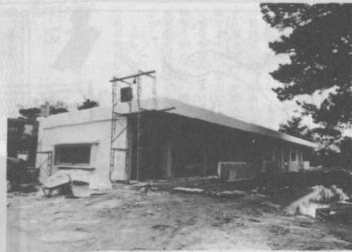
▲今帰仁小学校普通教室

新年度に向けて、今帰仁小学校ならびに今帰仁中学校において普通教室、特別教室の建設が進められています。