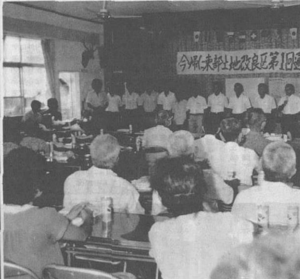
▲規約、役員などが選任された第1回総会