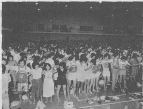
▲若者でにぎわった歓迎の夕べ(今中体育館)

自然に親しみながら、沖繩の文化を学ぼうと近畿地区の七〇余校の大学生の行八〇人が八月十七