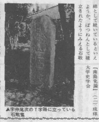
▲字仲尾次の丁字路に立っている石敢當

石敢當に付与された思想は、「招福驱邪」の考えである。福を招き邪鬼を払うという觀念が裏かかっている。石敢當は、字が刻まれているものもある。また、「泰山石敢當」と刻まれたものもある。いずれもその意味性については