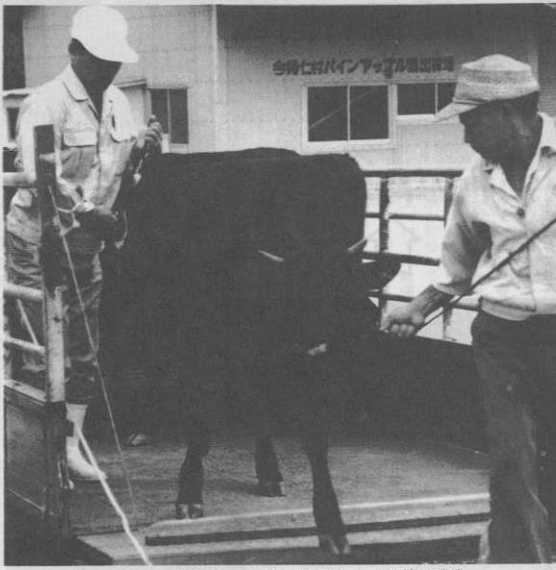
写真—広島県から導入された繁殖雌牛

編集発行 今帰仁村役場企画室 〒905-04 沖縄県今帰仁村字仲宗根219 T E L 098056-2101 印刷 沖縄高速印刷機 南風原村字兼城577 T E L 0988-32-5513