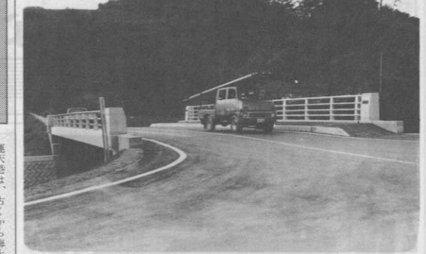
新しく建設された呉我山橋

消費者を保護するいろいろの表示 最近次々と新しい商品が出まわってきたため、商品の見分け方や使い方など一般の人にはなかなかわかりにくくなりました。