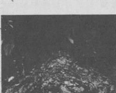
新しく建設された呉我山橋