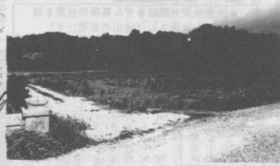
ほ場整備(呉我山地区)

昭和53年度において、進めておりました農村総合整備モデル事業実施計画がこの度まとまりました。 この実施計画は、農村総合整備計画に基づくもので、総事業費13億8千万円で7カ年計画となっています。 モデル事業は、農業生産基盤の整備とあわせて、農村の生活環境の整備を図るのが主目的で日頃、私達の最も関心の深い道路、排水、公園等の整備を全般的な内容としています。 具体的には、本モデル事業のひとつの目玉として、農村公園を15ヶ所、地域コミュニティの発展を目的として、古宇利島に農村環境改善センター(サブセンター)の設置を予定しています。また圃場整備三地区、農業排水10条、農道11条、集落道50条、集落排水41条等の整備が計画されています。 この事業のひとつの特徴は、地域住民の要望に基づいて作成されている点です。当初各字から多くの要望事業が申請されましたが、現況調査、集落診断の結果を考慮しつつ、モデル事業の主旨、規定、総事業費等と照し合わせ、十数回にもわたる県および国との調整を行い、現在の事業量にまとまりました。 計画の作成にあたって、字を単位とした連絡協議会、村全体の推進協議会を設置し、推進体制を確立するとともに、部落懇談会をもつなどして住民の声が充分反映されるよう努めました。 今年度からいよいよ事業の実施が始まります。路線の拡張、敷地の拡大等に併ない遺地の出る所も多数あります。村民の御協力がなければ事業の実施は不可能ですので、今後スムーズに事業を推進し、住みよい今帰仁村の建設に村ぐるみで取り組んでいく必要があります。