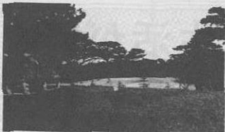
農村公園整備(崎山地区)