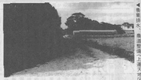
農業排水、農道整備(上運天地区)