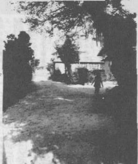
集落道整備(天底地区)