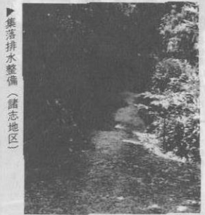
集落排水整備(諸志地区)

昭和53年度において、進めておりました農村総合整備モデル事業実施計画がこの度まとまりました。 この実施計画は、農村総合整備計画に基づくもので、総事業費13億8千万円で7カ年計画となっています。 モデル事業は、農業生産基盤の整備とあわせて、農村の生活環境の整備を図るのが主目的で日頃、私達の最も関心の深い道路、排水、公園等の整備を全般的な内容としています。 具体的には、本モデル事業のひとつの目玉として、農村公園を15ヶ所、地域コミュニティの発展を目的として、古宇利島に農村環境改善センター(サブセンター)の設置を予定しています。また圃場整備三地区、農業排水10条、農道11条、集落道50条、集落排水41条等の整備が計画されています。 この事業のひとつの特徴は、地域住民の要望に基づいて作成されている点です。当初各字から多くの要望事業が申請されましたが、現況調査、集落診断の結果を考慮しつつ、モデル事業の主旨、規定、総事業費等と照し合わせ、十数回にもわたる県および国との調整を行い、現在の事業量にまとまりました。 計画の作成にあたって、字を単位とした連絡協議会、村全体の推進協議会を設置し、推進体制を確立するとともに、部落懇談会をもつなどして住民の声が充分反映されるよう努めました。 今年度からいよいよ事業の実施が始まります。路線の拡張、敷地の拡大等に併ない遺地の出る所も多数あります。村民の御協力がなければ事業の実施は不可能ですので、今後スムーズに事業を推進し、住みよい今帰仁村の建設に村ぐるみで取り組んでいく必要があります。