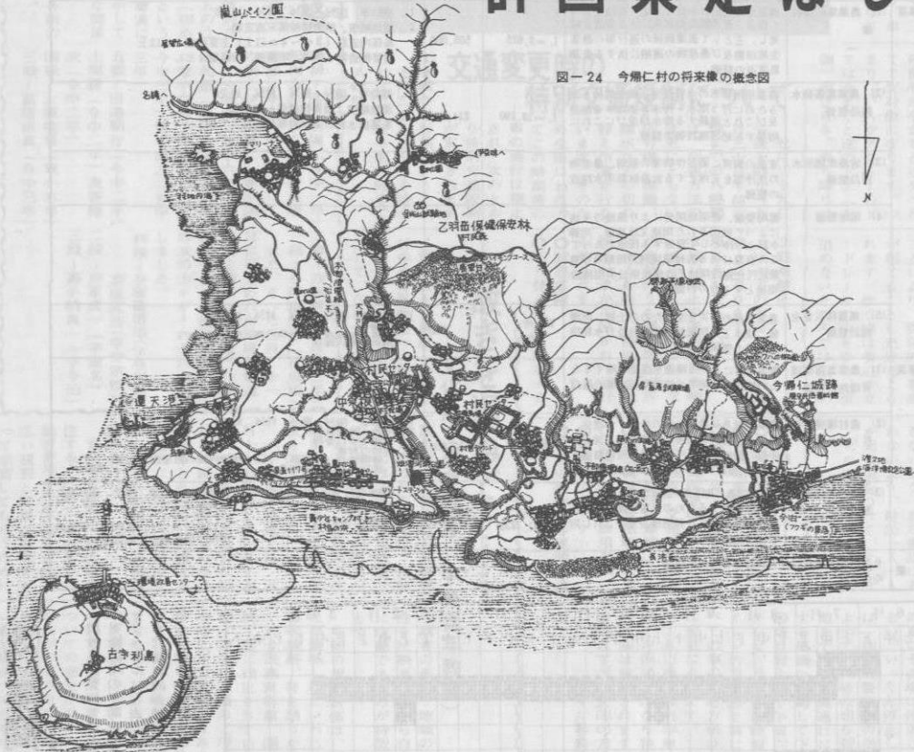
図-24 今帰仁村の将来像の概念図