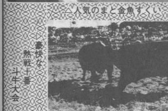
人気のまど金魚すくい

***** 昭和五十二年度 今帰仁村産業まつりが去る九月十四日から十七日までの四日間行なわれました。一村産業まつりは、村のイメージを内外にアピールするとともに、各産業の振興をはかる恒例の村行事ですが、今年は畜産共進会、セリ市、斗牛大会、総合展示会に加えて素人の目撃大会、舞踊大会、パレード、青年市、ダンスの集いなど、多彩な催し物があがり、これまで一万余の村民が楽しい「まつり」を過ごしました。*****