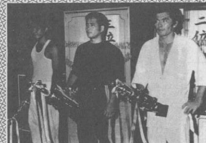
相撲大会の豪者がズラリ