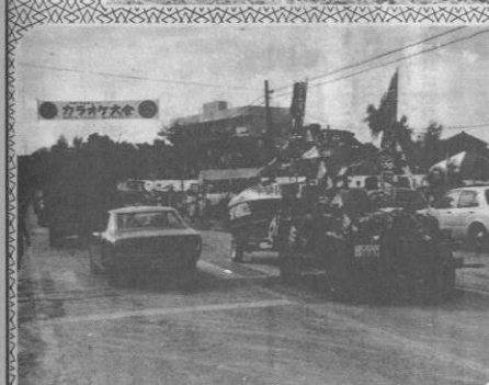
まつりを飾ったパレード

***** 昭和五十二年度 今帰仁村産業まつりが去る九月十四日から十七日までの四日間行なわれました。一村産業まつりは、村のイメージを内外にアピールするとともに、各産業の振興をはかる恒例の村行事ですが、今年は畜産共進会、セリ市、斗牛大会、総合展示会に加えて素人の目撃大会、舞踊大会、パレード、青年市、ダンスの集いなど、多彩な催し物があがり、これまで一万余の村民が楽しい「まつり」を過ごしました。*****