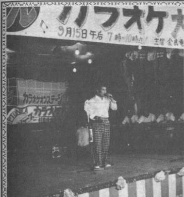
自慢のものを披露 カラオケ大会