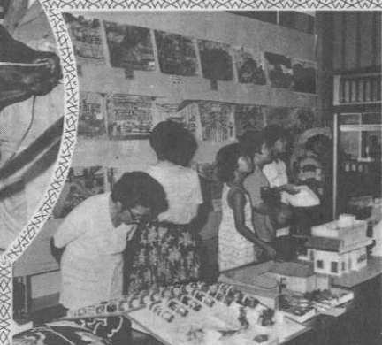
各展示物に人気(中央公民館)