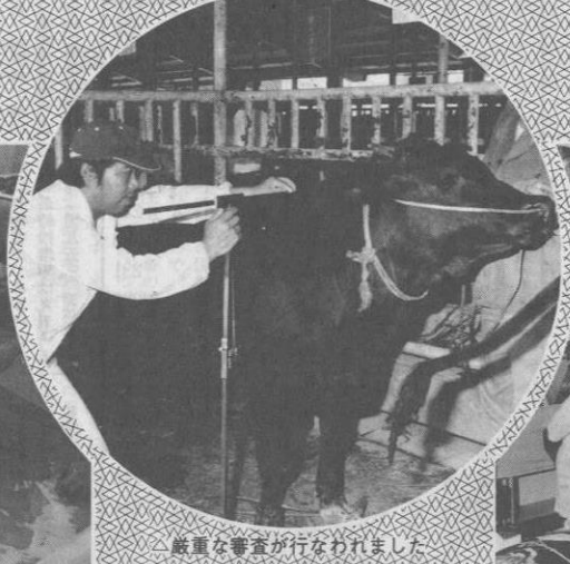
厳重な審査が行なわれました