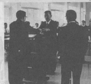
▲1人1人に当選証書が授与

氏は「村長を助けながら、村民の代表として、村の政治、教育、文化等の発展のため、たくしつていきたいと思います。」と今後の抱負をはなしていました。