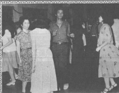
時のたつのを忘れたダンスの集い