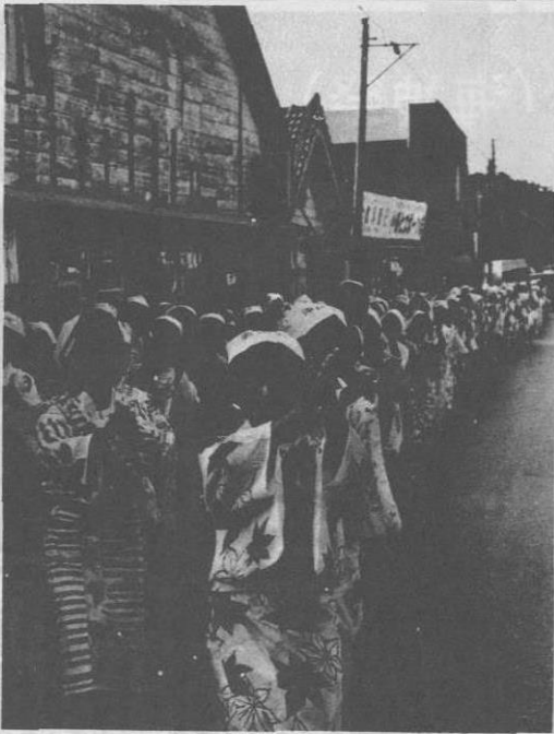
婦人会の踊りは海洋博中、世界の人々に見てもらおう