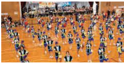
エイサーを披露する3年生