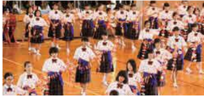
琉舞を披露する1・2年生