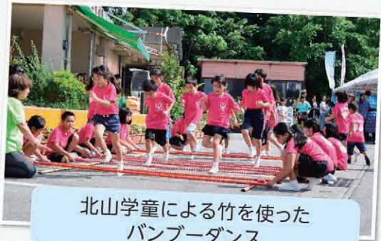
北山学童による竹を使ったバンブーダンス