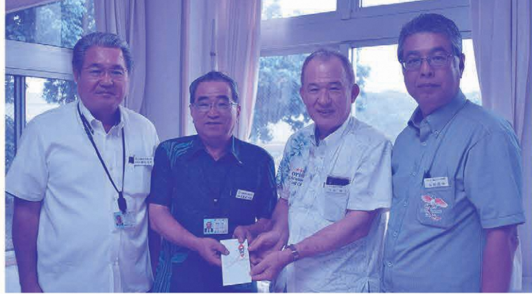
寄付金を贈呈するオリオン嵐山ゴルフ倶楽部の小谷総支配人（右から2番目）と与那国支配人（右から1番目）

収益金は、子ども育成基金に積み立てし、子ども達のスポーツや文化活動の派遣費用などに活用します。大会へ寄付・寄贈頂いた皆様、大変ありがとうございました。