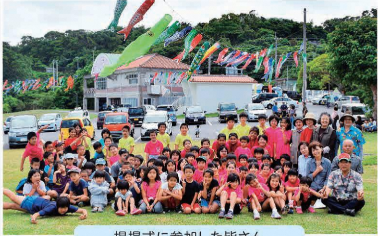
掲揚式に参加した皆さん

また、同じ日には、今帰仁の駅「そくれ」において、「そくれ大感謝祭」が開催されました。会場には、村内外から多くの方々が集まり、大型連休の初日を楽しんでいました。また、特設ステージ