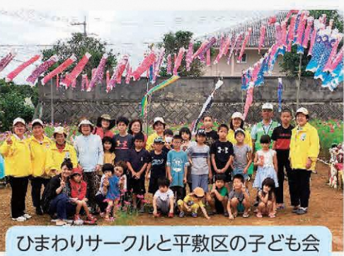
ひまわりサークルと平敷区の子ども会