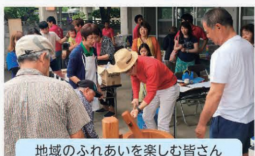
地域のふれあいを楽しむ皆さん

平敷区の「やさい屋」の向かいにある「かかし広場」。そこは、ひまわりサークル(平敷区の花壇整備の有志の会)が手入れする花とかかしが多くあります。大型連休に入って間もなく、ひまわりサークルと子ども会による、こいのぼり掲揚式が行われ、綺麗な花畑の上を約200余りのこいのぼりが泳いでいました。