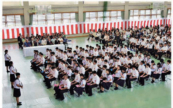
沖縄県立北山高等学校(91名)