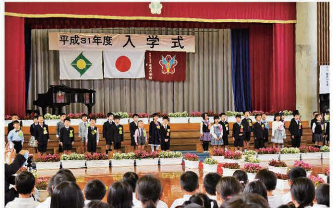
村立天底小学校(27名)