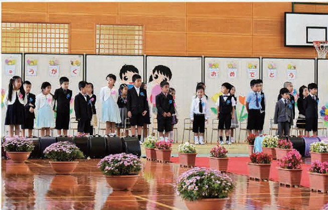
村立兼次小学校(22名)