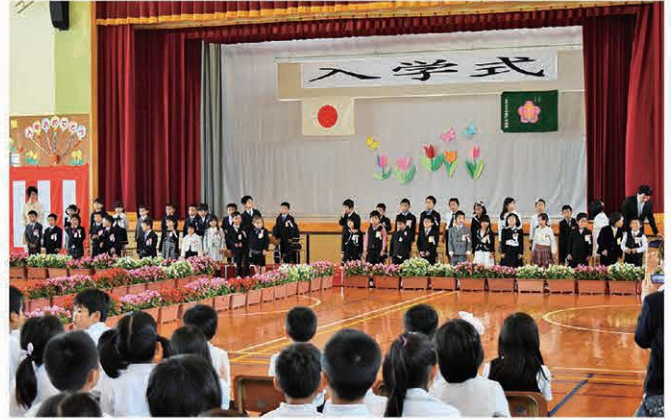
村立今帰仁小学校(42名)