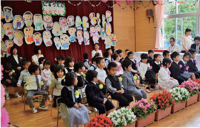
村立今帰仁幼稚園(36名)