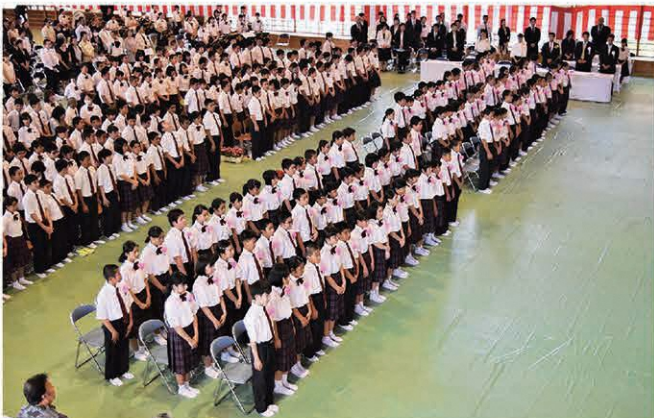
村立今帰仁中学校(95名)